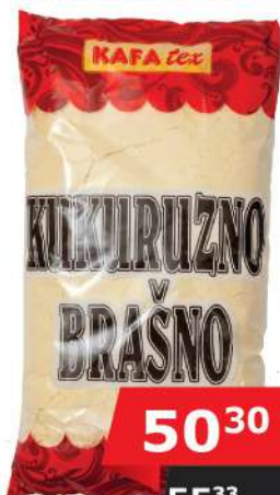
KAFATEX KUKURUZNO BRAŠNO 750G