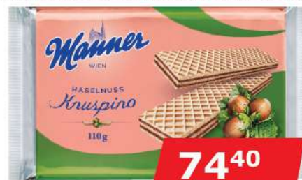
MANNER NAPOLITANKE LEŠNIK 110G