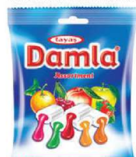
TAYAS BOMBONE DAMLA MIX 500G