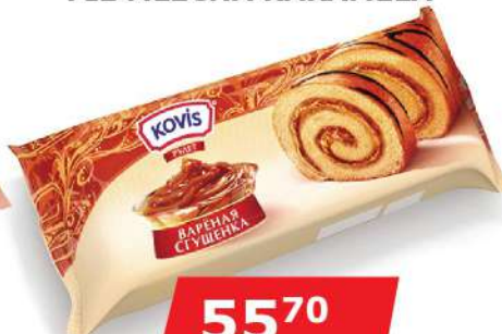
KOVIS ROLAT 200G FIL MLEČNA KAREMELA