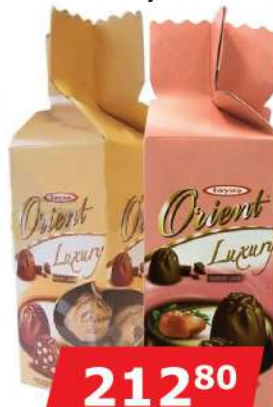
TAYAS OREINT TRUFLE 265G LEŠNIK/JAGODA