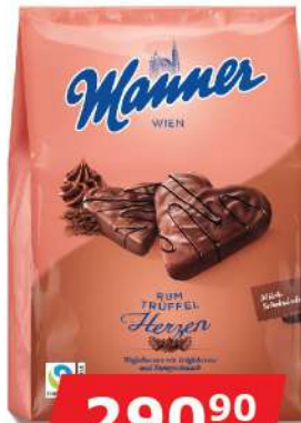
MANNER RUM TRUFFEL SRCA 300G