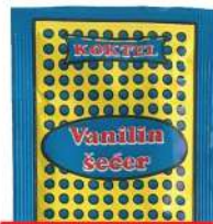
KOKTEL VANILIN ŠEĆER 10G