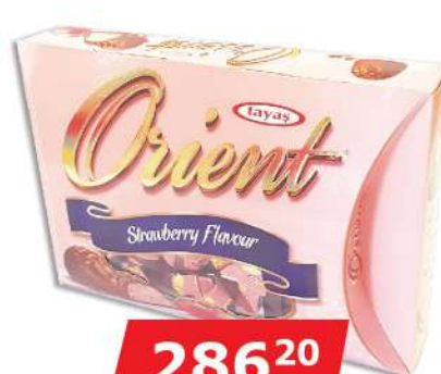
TAYAS OREINT TRUFLE 275G JAGODA