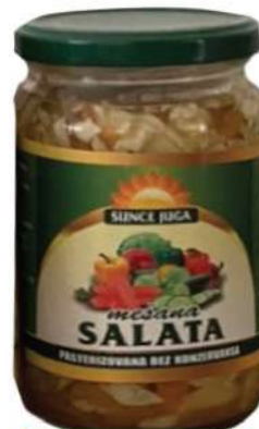
SUNCE JUGA MEŠANA SALATA 670G