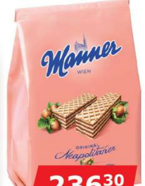
MANNER NAPOLITANKE LEŠNIK 400G