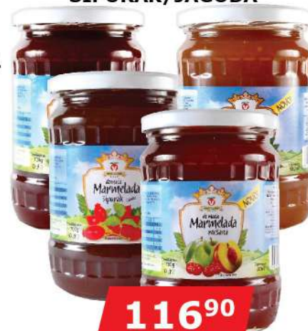
VOČAR MARMEĽADA 700G KAJSIJA/MEŠANA ŠIPURAK/JAGODA