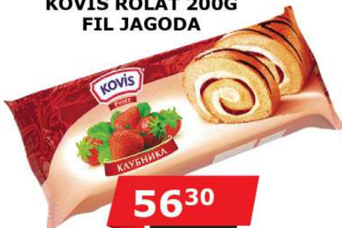
KOVIS ROLAT 200G FIL JAGODA