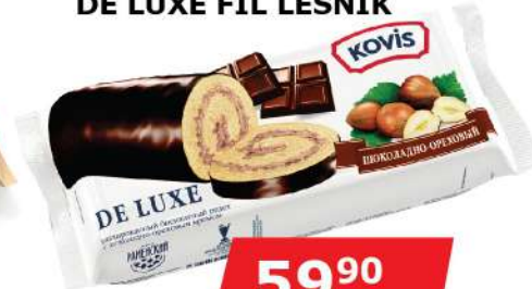
KOVIS COKO ROLAT 200G DE LUXE FIL LESNIK