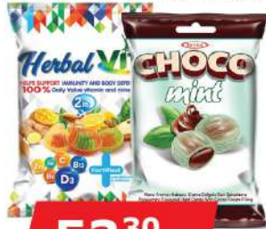
TAYAS BOMBONE 90G HERBAL VIT/CHOCO MINT