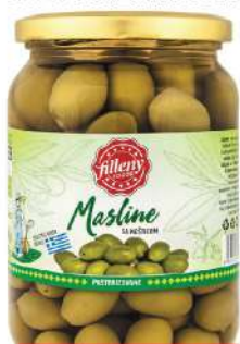
LOV MASLINE 700G ZELENE SK