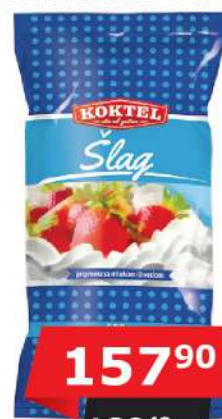
KOKTEL ŠLAG PENA 500G