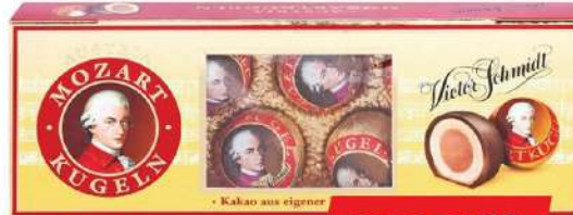
MOZART KUGLE 132G