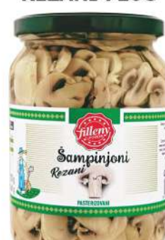
LOV ŠAMPINJONI REZANI 720G