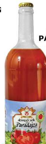
VOČAR SOK OD PARADAJZA 1KG