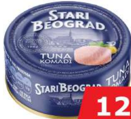
TUNA KOMADI 160G