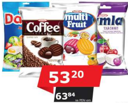
TAYAS BOMBONE 90G VIŠE VRSTA