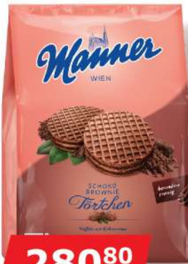
MANNER TORTICE CHOCO-BROWNIE 400G