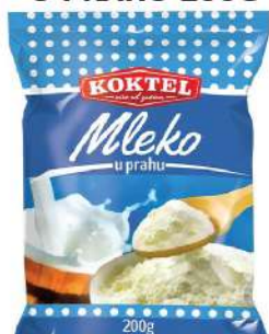
KOKTEL MLEKO U PRAHU 200G