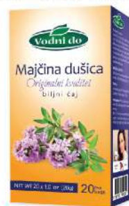
VODNI DO ČAJ 20G MAJČINA DUŠICA