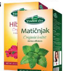
VODNI DO ČAJ MATIČNJAK 20G HIBISKUS 30G