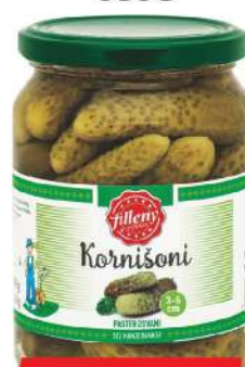
LOV KORNİŠONI 680G