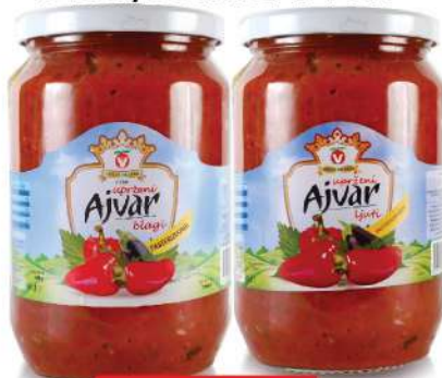
VOČAR AJVAR 690G BLAGI/LJUTI UPRŽENI