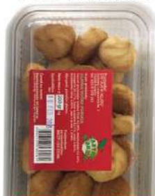
ZLATNA VOĆNA PUSLICA 200G