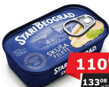
SKUŠA FILETI 100G