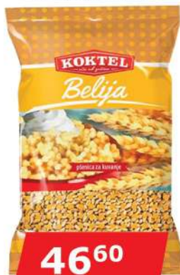
KOKTEL PŠENICA BELIJA 500G