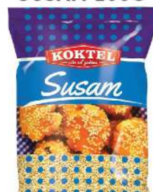
KOKTEL SUSAM 100G