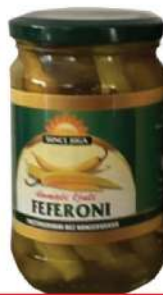
SUNCE JUGA FEFERONI 310G