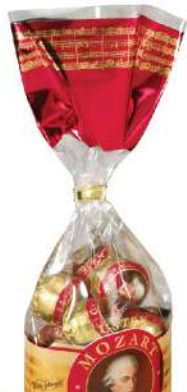
MOZART KUGLE 264G