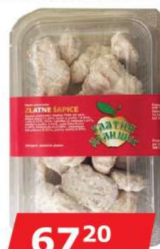
ZLATNA ŠAPIKA 250G