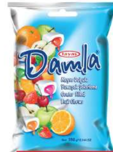
TAYAS BOMBONE DAMLA MIX 350G