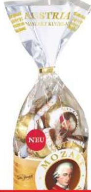
MOZART KUGLE 231G BELA ČOKOLADA