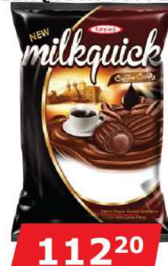
TAYAS BOMBONE 300G MILKQUICK COFFEE