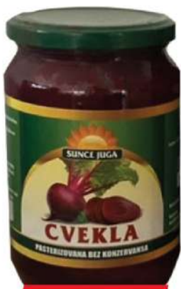
SUNCE JUGA CVEKLA 690G