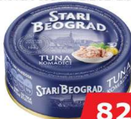
TUNA KOMADIĆI 160G