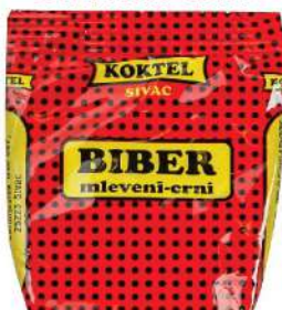
KOKTEL BIBER 50G CRNI MLEVENI