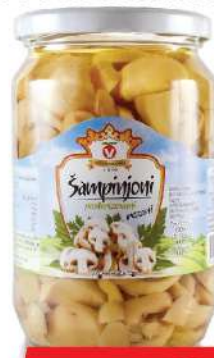
VOČAR ŠAMPINJONI REZANI 680G PASTERIZOVANI