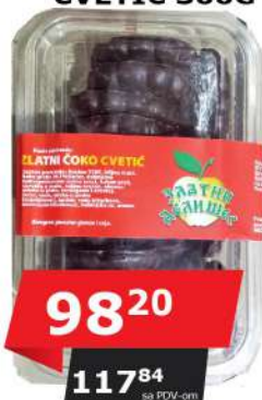
ZLATNI ČOKO CVETIĆ 300G