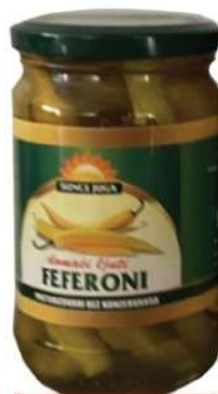
SUNCE JUGA FEFERONI 610G