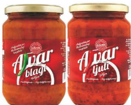
LOV AJVAR UPRŽENI 700G BLAGI/LJUTI