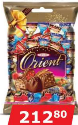
TAYAS OREINT TRUFLE 500G SPECIJAL