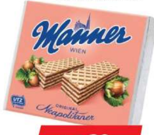
NAPOLITANKE LEŠNIK 75G