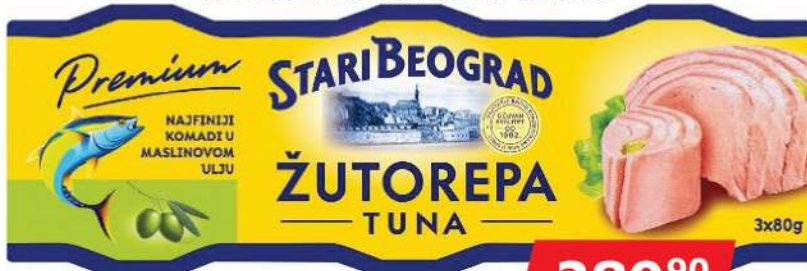
ŽUTOREPA TUNA KOMADI U MASLINOVOM ULJU 3X80G