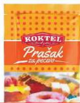
KOKTEL PRAŠAK ZA PECIVO 10G