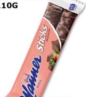
MANNER ČOKO ŠTAPIČI 30G