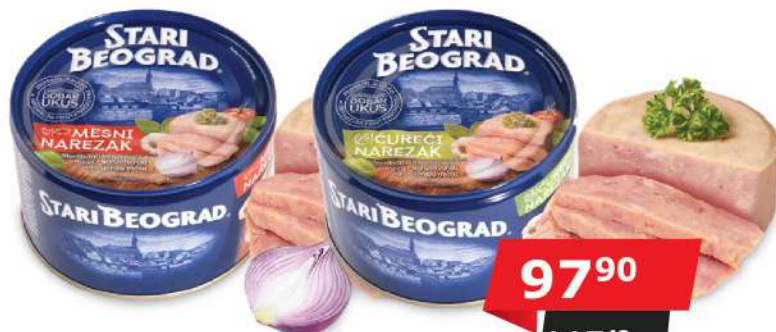
MESNI NAREZAK 400G ČUREČI NAREZAK 400G