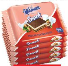
MANNER NAPOLITANKE 5X25G MLEKO&LEŠNIK