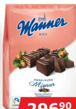
MANNER MINJON LEŠNIK 400G