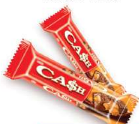
TAYAS ČOKOLADICE KASH 23G