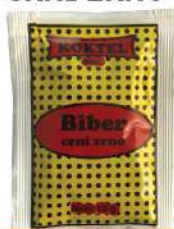
KOKTEL BIBER 10G CRNI ZRNO