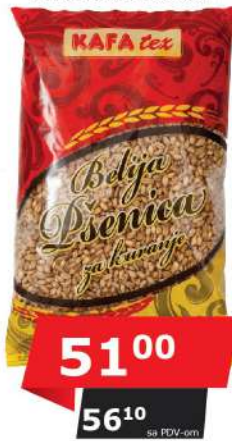
KAFATEX PŠENICA BELIJA 500G