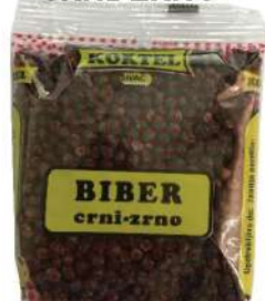
KOKTEL BIBER 50G CRNI ZRNO