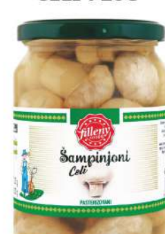
LOV ŠAMPINJONI CELI 720G