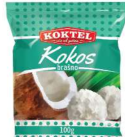
KOKTEL KOKOS BRAŠNO 100G