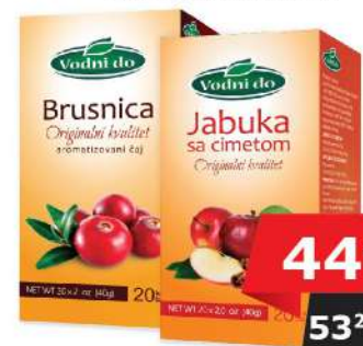
VODNI DO ČAJ 40G BRUSICA JABUKA&CIMET