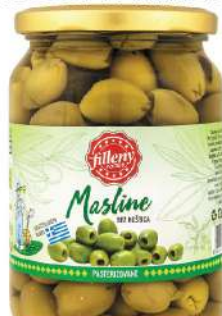
LOV MASLINE 680G ZELENA BK