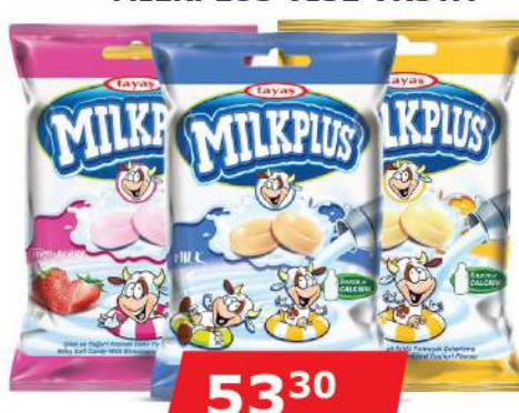
TAYAS BOMBONE 80G MILKPLUS VIŠE VRSTA