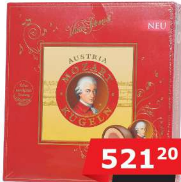
MOZART KUGLE 247G