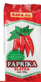
KAFATEX SLATKA PAPRIKA 100G