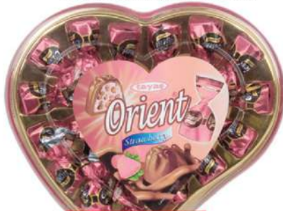
TAYAS BOMBONJERA ORIENT SRCE-JAGODA 193G