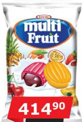
TAYAS BOMBONE 1KG MULTI FRUIT