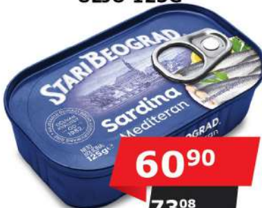
SARDINA U BILJNOM ULJU 125G