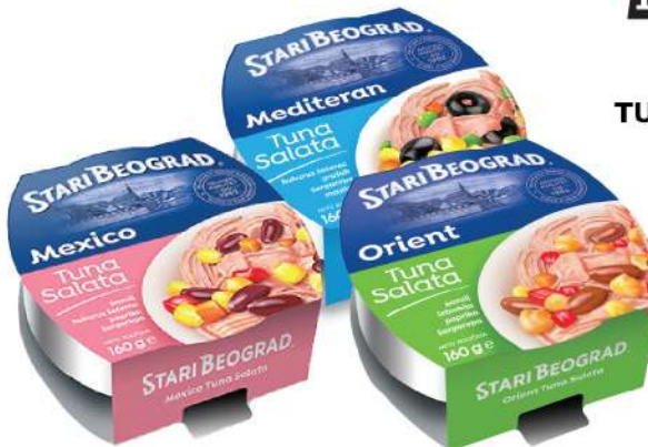
TUNA SALATA 160G MEXICO MEDITERAN ORIENT