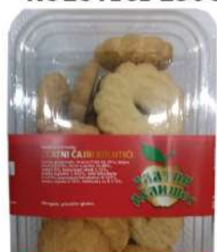
ZLATNI ČAJNI KOLUTIĆI 250G