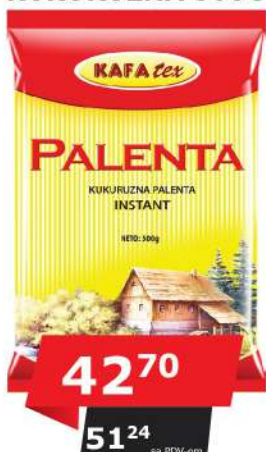
KAFATEX PALENTA KUKURUZNA 500G