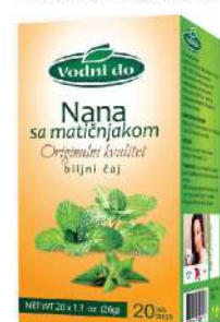
VODNI DO ČAJ 26G NANA SA MATIČNJAKOM