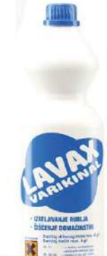
LVZ IZBELJIVAČ RUBLJA 1/1