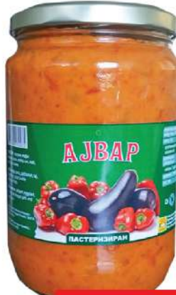
BAŠ AJVAR 660G PASTERIZOVAN