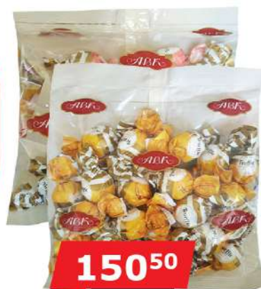
TRUFLE 300G MANGO/TROPIC MIX