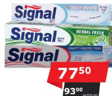
SIGNAL PASTA ZA ZUBE 75ML VIŠE VRSTA