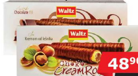
WALTZ CHOČO ROLLS 80G LEŠNIK/ČOKOLADA