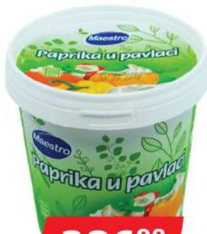
MAESTRO PAPRIKA U PAVLACI 670G