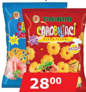
SL ČAROBNJACI FLIPS 50G PIZZA/ŠUNKA