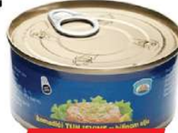
MS MALIBU TUNJEVINA SITNA 170G