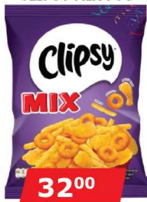
CLIPSY MIX 70G