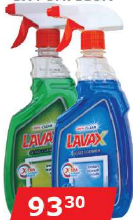
LAVAX LAVAZZINO 750ML ZA STAKLO EUKALIPTUS/PARFUMED SA PUMPICOM