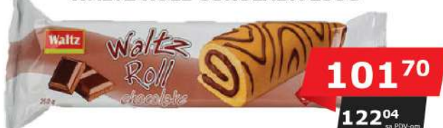
WALTZ ROLL ČOKOLADA 250G