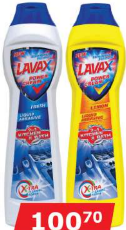
LAVAX ABRAZIV 500ML FRESH/LEMON