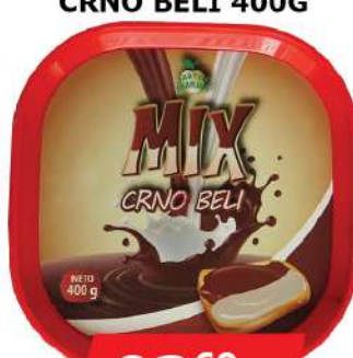
ZD MIX CRNO BELI 400G