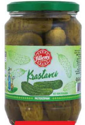
LOV KRASTAVČIĆI 680G