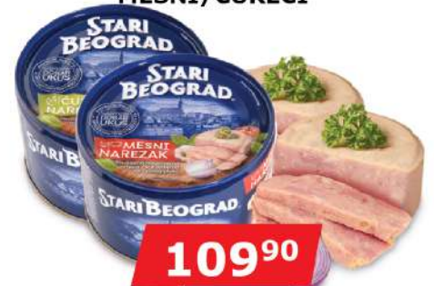
TGK NAREZAK 400G MESNI/ČUREČI