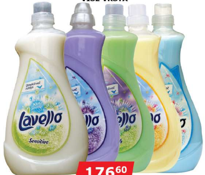
LAVELLO OMEKŠIVAČ 2L VIŠE VRSTA