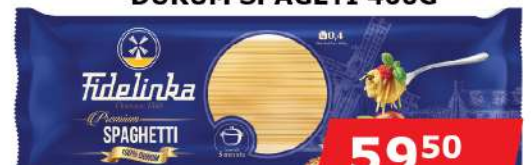
DURUM ŠPAGETI 400G