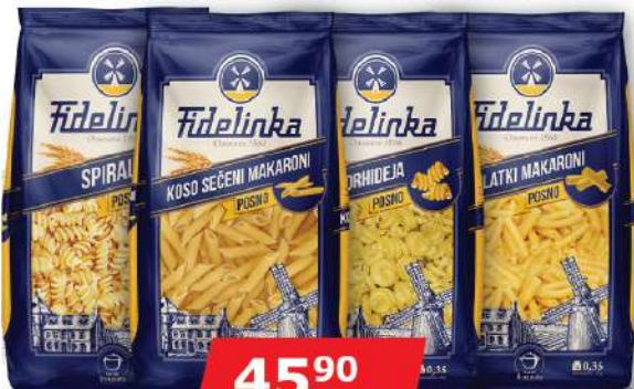
TESTENINA 350G VIŠE VRSTA