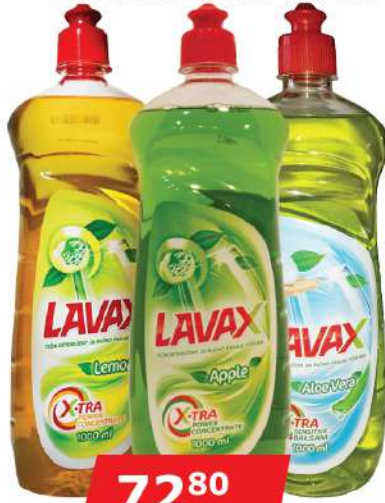
LAVAX DETERDŽENT ZA SUDOVE 1L VIŠE VRSTA