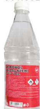
ALKOHOL 1L 70%VOL