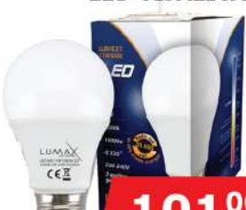
ALFA ECO LUME27-11W 6500K 1000LM LED SIJALICA