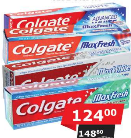
COLGATE MAX PASTA ZA ZUBE 100ML VIŠE VRSTA