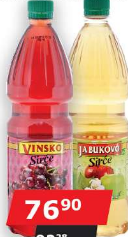
STATUS SIRĆE 1L VINSKO/JABUKOVO