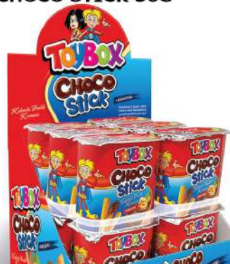
LBD TOY BOX CHOCO STICK 56G