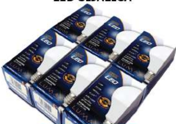
ALFA ECO LUME27-11W 3000K 1000LM LED SIJALICA