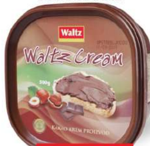
WALTZ CREAM 500G KAKAO