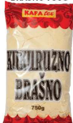
KUKURUZNO BRAŠNO 750G