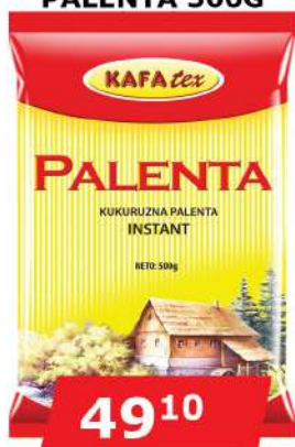
KUKURUZNA PALENTA 500G