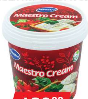
MAESTRO CREAM 670G