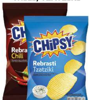
CHIPSY ČIPS 40G CHILI/TZATZIKI