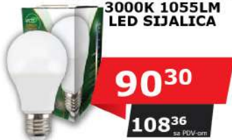
ALFA ECO LUME27-12W 3000K 1055LM LED SIJALICA