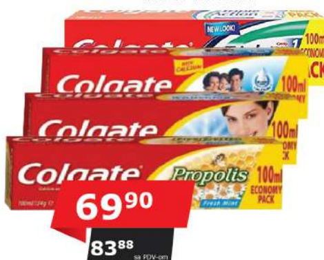
COLGATE PASTA ZA ZUBE 100ML VIŠE VRSTA