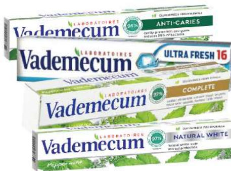
VADEMECUM PASTA ZA ZUBE 75ML VIŠE VRSTA