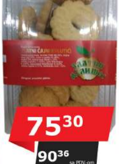
ZD ZLATNI MIX KOLAČ 500G