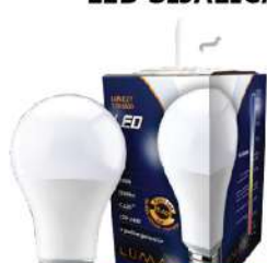
ALFA ECO LUME27-13W 6500K 1280LM LED SIJALICA