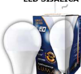
ALFA LUME27-18W 3000K 1750LM LED SIJALICA