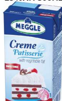
CREME PATISSERIE SLATKA PAVLAKA 25%MM 500ML