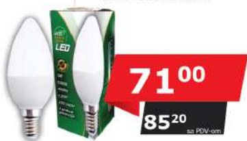
ALFA ECO LUME14-5W 3000K 400LM LED SIJALICA