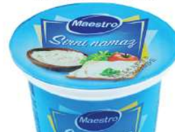
MAESTRO SIRNI NAMAZ 250G