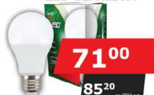
ALFA ECO LUME27-9W 3000K 810LM LED SIJALICA