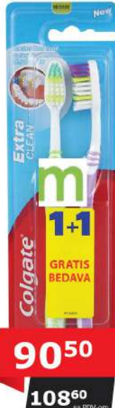
ČETKICA EXTRA CLEAN 1+1