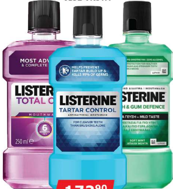
LISTERIN 250ML VIŠE VRSTA