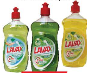
LAVAX DETERDŽENT ZA SUDOVE 0,5L