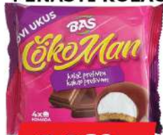
BAŠ ČOKOMAN 56G PENASTI KOLAČ