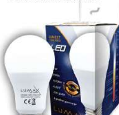
ALFA LUME27-15W 3000K 1510LM LED SIJALICA