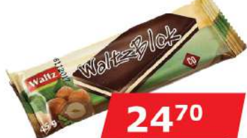
WALTZ BLOK 45G