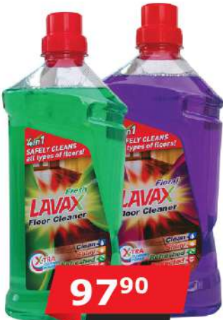
LAVAX SREDSTVO ZA PODOVE 1/1 ZELENO/LJUBIČASTO