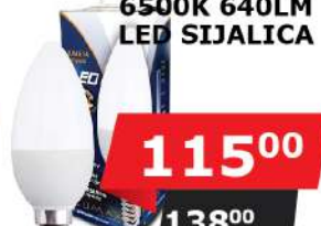
ALFA ECO LUME14-8W 6500K 640LM LED SIJALICA