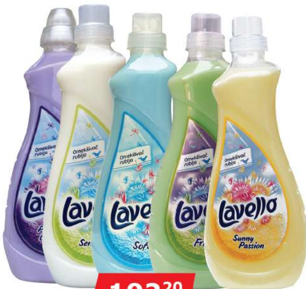
LAVELLO OMEKŠIVAČ 1L VIŠE VRSTA