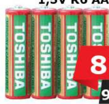
BATERIJE TOSHIBA 1,5V R6 AA 4/1 HD