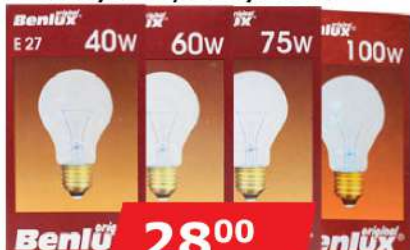
BENLUX SIJALICA E-27 40W/60W/75W/100W