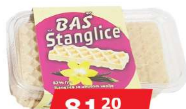
BAŠ ŠTANGLICE 300G VANILA