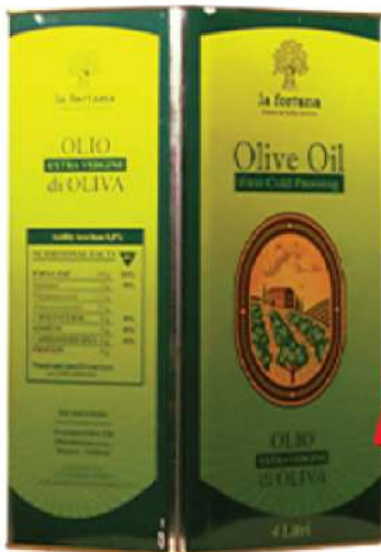
EXTRA VIRGIN OLIVE 4L LIMENKA