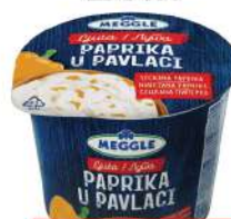
MEGGLE PAPRIKA U PAVLACI 230G LJUTA