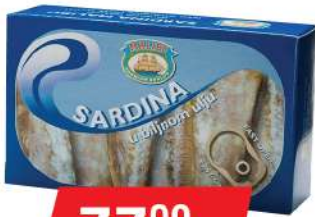
MS MALIBU SARDINA U ULJU 125G