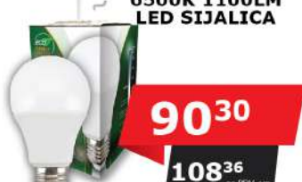
ALFA ECO LUME27-12W 6500K 1100LM LED SIJALICA