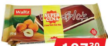
WALTZ BLOK 3X90G