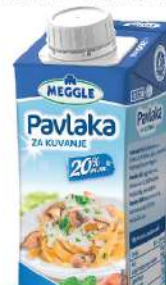
MEGGLE PAVLAKA ZA KUVANJE 200ML 20%MM