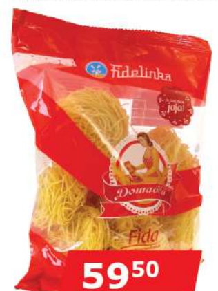
FIDA SA JAJIMA 400G