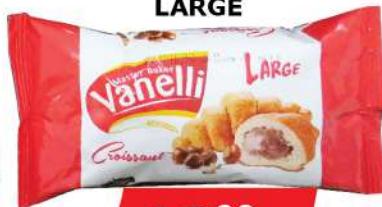
VANELI KROASAN 50G LARGE