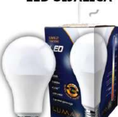
ALFA ECO LUME27-13W 3000K 1280LM LED SIJALICA