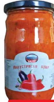
BAŠ AJVAR 680G INDUSTRIJSKI