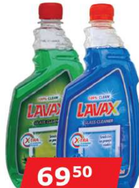
LAVAX LAVAZZINO 750ML ZA STAKLO EUKALIPTUS/PARFUMED BEZ PUMPICE