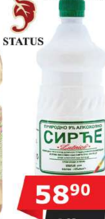
STATUS SIRĆE 1L ALKOHOLNO