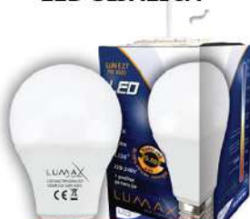
ALFA LUME27-7W 3000K 630LM LED SIJALICA