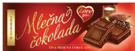
SL LOVE YOU 200G ML.ČOKOLADA