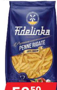
DURUM KOSO SEČENA MAKARONA 400G