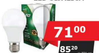
ALFA ECO LUME27-9W 6500K 810LM LED SIJALICA