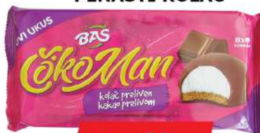
BAŠ ČOKOMAN 112G PENASTI KOLAČ