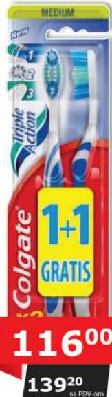
ČETKICA 1+1 TRIPLE ACTION