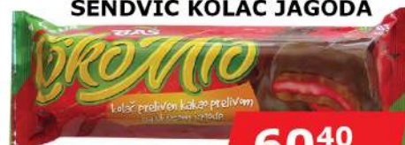
BAŠ ČOKOMIO 200G SENDVIČ KOLAČ JAGODA