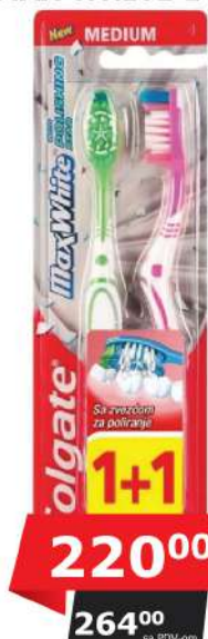
ČETKICA MAX WHITE 1+1