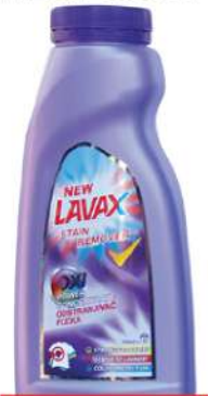
LAVAX ODSTRANJIVAČ FLEKA 500ML