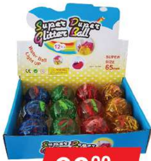
LBD LOPTICA SKOČICA SVETLEĆA