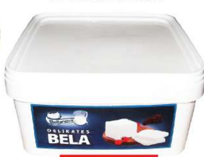
BELLANOVA BELA DELIKATES 5KG