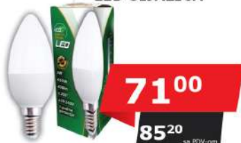
ALFA ECO LUME14-5W 6500K 400LM LED SIJALICA