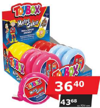
LBD TOY BOX ŽVAKE 35G