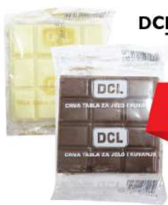
DCP KAKAO/BELA TABLA 100G ZA JELO I KUVANJE