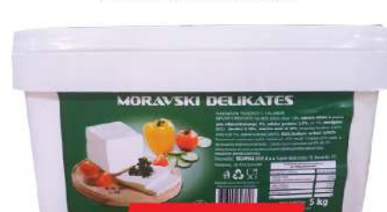
LILIĆ MORAVSKI SIR DELIKATES 5KG