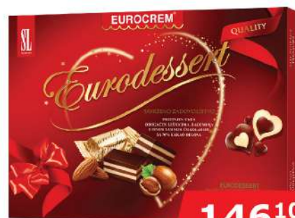
SL EURODESSERT 5 160G