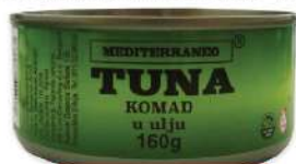
MS MEDITERANEO TUNJEVINA KOMAD 160G