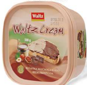
WALTZ CREAM 500G MIX