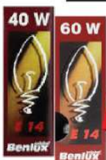
BENLUX SIJALICA E-14 40W/60W