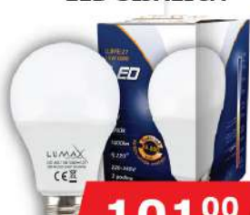
ALFA ECO LUME27-11W 3000K 1000LM LED SIJALICA