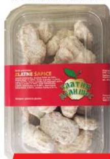
ZD ZLATNA ŠAPIKA 250G