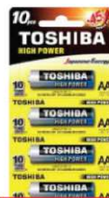
BATERIJE TOSHIBA AA 1.5V R6 ALKALNE