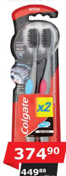
ČETKICA 360 BLACK 1+1