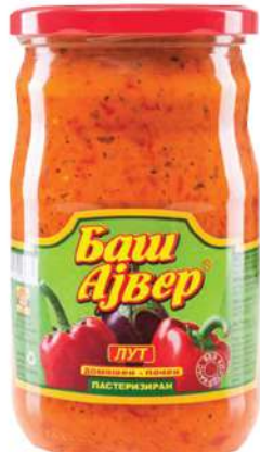
BAŠ AJVAR 660G LJUTI