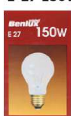
BENLUX SIJALICA E-27 150W