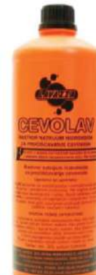
LVZ CEVOLAV 1/1