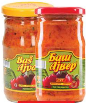
BAŠ AJVAR 290G BLAGI/LJUTI