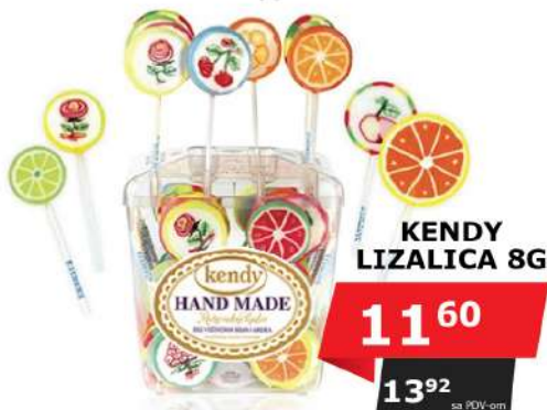
KENDY LIZALICA 8G