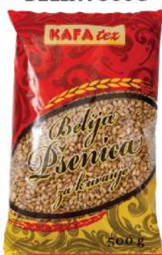
PŠENICA BELIJA 500G