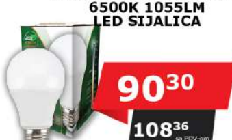
ALFA ECO LUME27-12W 6500K 1055LM LED SIJALICA