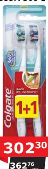
ČETKICA MEDIUM 360 1+1