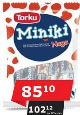
MINIKI MINI NUGAT BAR 240G