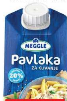
MEGGLE PAVLAKA ZA KUVANJE 500ML 20%MM