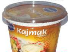
KAJMAK NAMAZ 250G