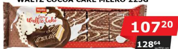
WALTZ COCOA CAKE MLEKO 225G