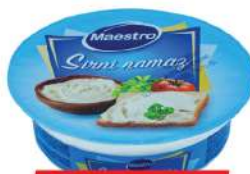
MAESTRO SIRNI NAMAZ 100G