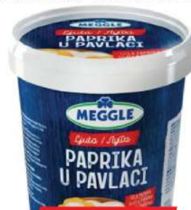
MEGGLE PAPRIKA U PAVLACI 700G LJUTA