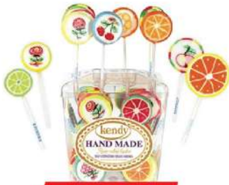
KENDY LIZALICA 8G