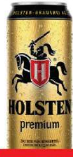
HOLSTEN PIVO 0,5L