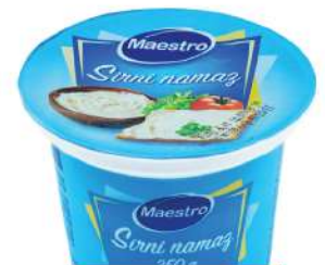
MAESTRO SIRNI NAMAZ 250G