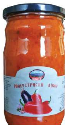
BAŠ AJVAR 680G INDUSTRIJSKI