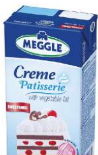
CREME PATISSERIE SLATKA PAVLAKA 25%MM 500ML