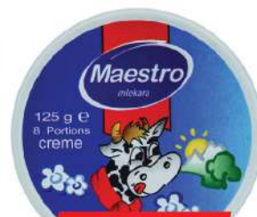
TOPLJENI SIR 125G