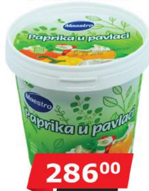
MAESTRO PAPRIKA U PAVLACI 670G