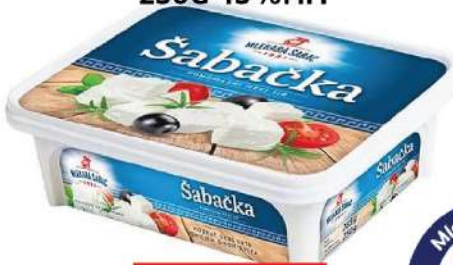
ŠABAČKA PUNOMASNI MEKI SIR 250G 45%MM