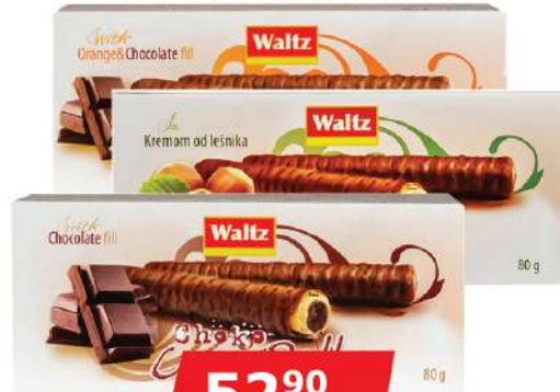
WALTZ ROLLS 80G VIŠE VRSTA