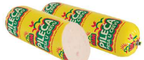
PANT KIM PILEĆA PRSA U CREVU 1KG