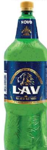
LAV PIVO 2L