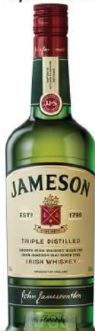
JAMESON 0,7L 40%