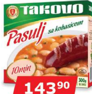
PASULJ SA KOBASICOM 300G