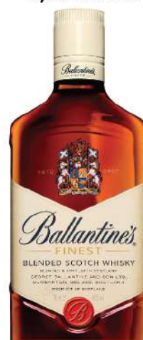
BALLANTINES 0,7L FINEST