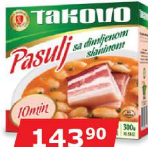
PASULJ SA DIM. SLANINOM 300G