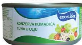
EXCELSIOR TUNA KOMADIĆI 160G U ULJU