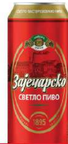
ZAJEČARSKO PIVO 0,5L