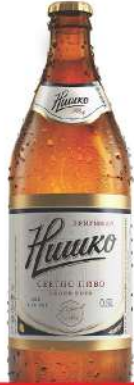
NIŠKO PIVO 0,5L