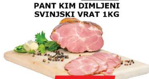
PANT KIM DIMJENI SVINJSKI VRAT 1KG