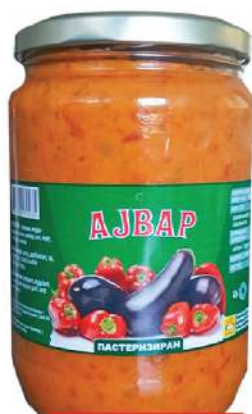
BAŠ AJVAR 660G PASTERIZOVAN