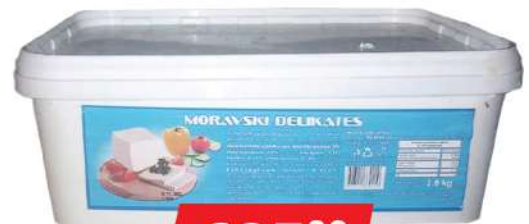
LILIĆ MORAVSKI SIR DELIKATES 2,8KG