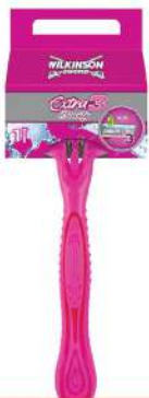
WILKINSON BRIJAČ EXTRA3 BEAUTY 1 KOM