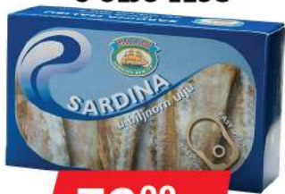
MS MALIBU SARDINA U ULJU 125G