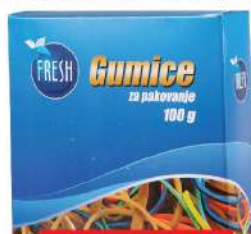
GUMICE ZA PAKOVANJE 200/1