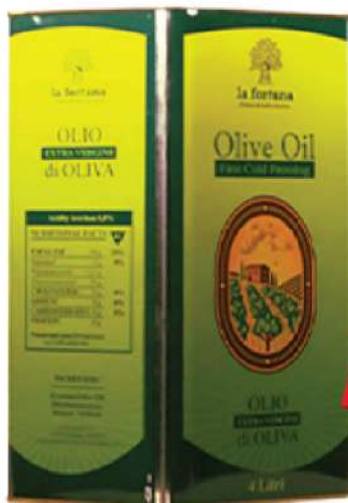
EXTRA VIRGIN OLIVE 4L LIMENKA