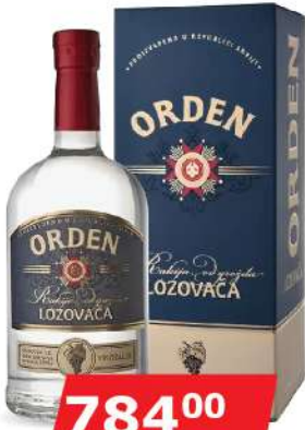
KALEM ORDEN LOZA 0,7L