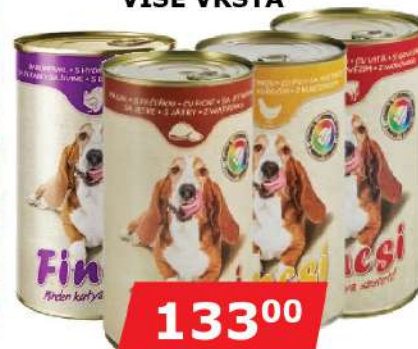
FINCSI ZA PSE 1240G VIŠE VRSTA