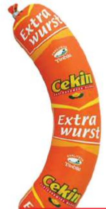
VIN EXTRAWURST 350G