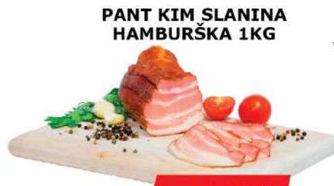
PANT KIM SLANINA HAMBURŠKA 1KG