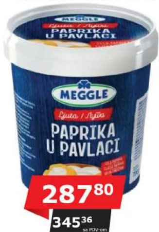
MEGGLE PAPRIKA U PAVLACI 700G LJUTA