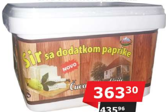
MILKOP SIR KRIŠKA 1KG SA DODATKOM PAPRIKE