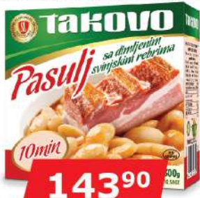
PASULJ SA DIMJENIM SVINJSKIM REBRIMA 300G