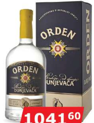
KALEM ORDEN DUNJA 0,7L