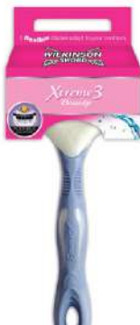
WILKINSON BRIJAČ XTREME3 BEAUTY 1 KOM