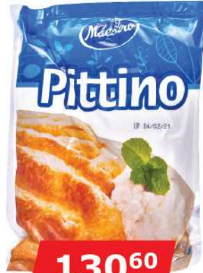
PITTINO SIR 450G