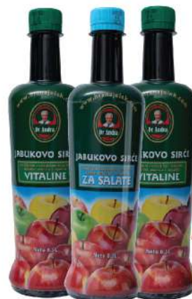
DR ANDRA SIRĆE 0,5L VIŠE VRSTA