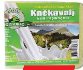
PODGORAC KAČKAVALJ 1KG