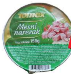
TOMEX MESNI NAREZAK 150G