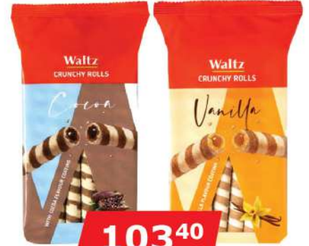
WALTZ CRUNCHY ROLLS 170G KAKAO/VANILA