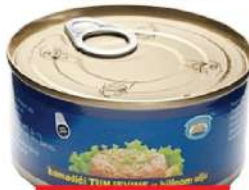
MS MALIBU TUNJEVINA SITNA 170G