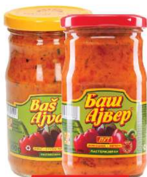
BAŠ AJVAR 290G BLAGI/LJUTI