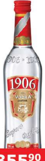
VODKA 1906 0,7L