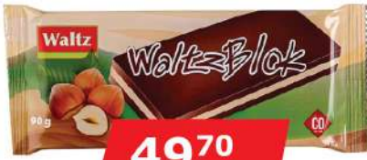
WALTZ BLOK 90G