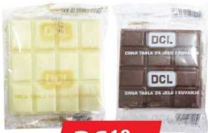
DCL TABLA ZA JELO I KUVANJE 100G BELA/CRNA