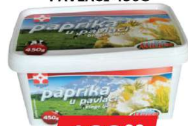
MILKOP PAPRIKA U PAVLACI 450G