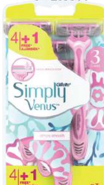
GILLETTE SIMPLY VENUS 3 BLADES 4+1KOM