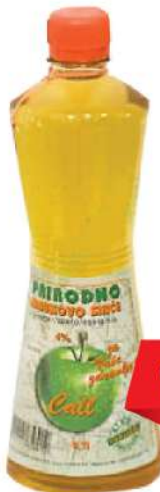
CALL SIRĆE 0,7L JABUKOVO