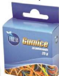
GUMICE ZA PAKOVANJE 400/1