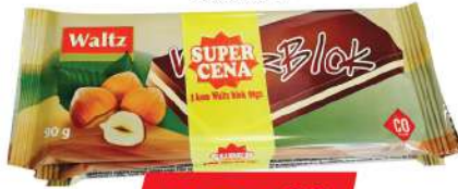
WALTZ BLOK 3X90G