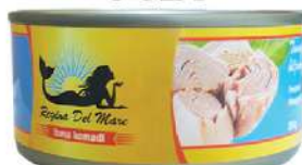
REGINA TUNA KOMADI 160G U ULJU