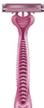
GILLETTE SIMPLY VENUS 3 BRIJAČ 1/1