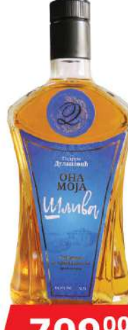
PODRUM DULANOVIĆ ONA MOJA RAKIJA 0,7L SLJIVA