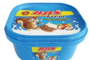
BAŠ KREM 500G MLEČNI