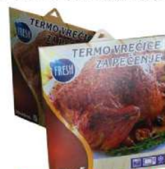
TERMO VREĆICE ZA PEČENJE 35X43CM