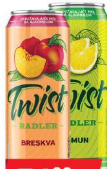
LAV TWIST PIVO 0,5L BRESKVA/LIMUN