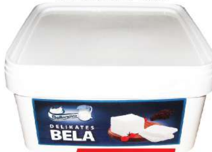
BELLANOVA BELA DELIKATES 5KG