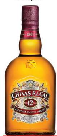
CHIVAS REGAL 12 0,7L