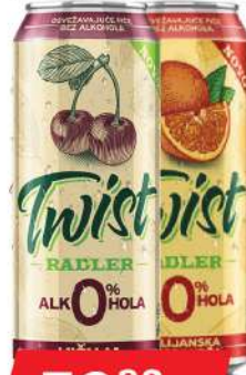
LAV TWIST PIVO 0,5L BEŽALK. VISNJA POMORANDŽA