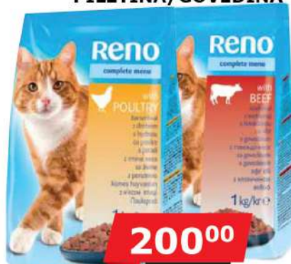
RENO ZA MAČKE 1KG DEHIDRIRANA HRANA PILETINA/GOVEDINA