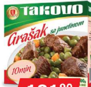
GRAŠAK SA JUNETINOM 300G