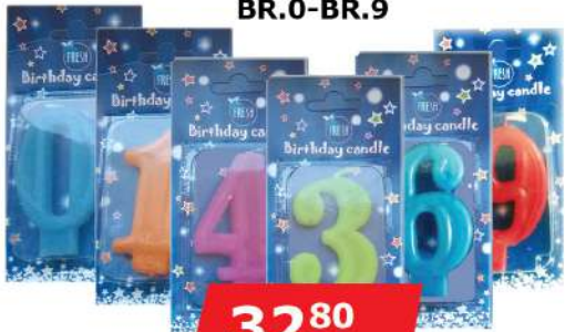
ROĐENDANSKA SVEČICA BR.0-BR.9