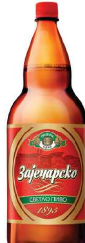
ZAJEČARSKO PIVO 2L