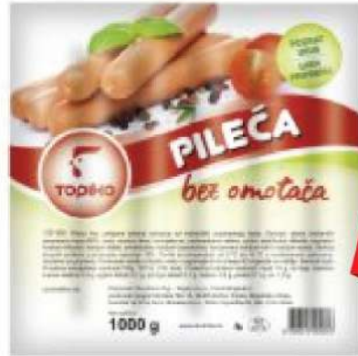
PP TOPIKO PILEĆA VIRŠLA BEZ OMOTAČA 1KG