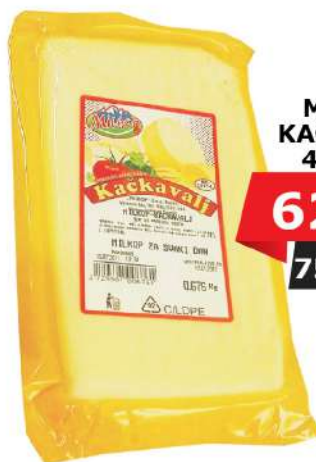
MILKOP KAČAVALJ 45%MM