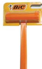
BIC SENSITIVE BRIJAČ 1/1 HC