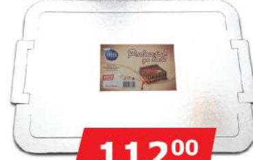
FRESH PODMETAČ ZA TORTU 395CM*290CM