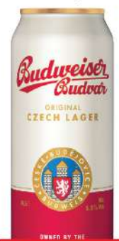
BUDWEISER PIVO 0,5L