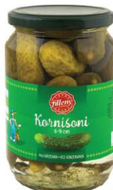
LOV KRASTAVČIĆI 680G