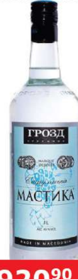
MASTIKA 1L STRUMICKA