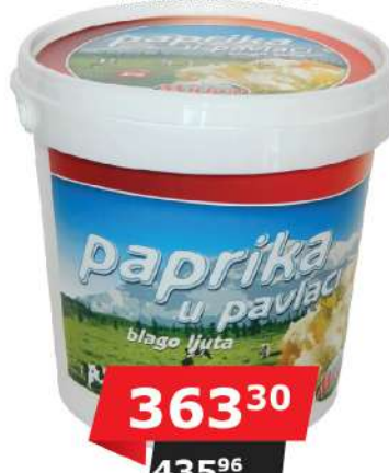
MILKOP PAPRIKA U PAVLACI 1KG