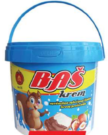
BAŠ KREM 800G MLEČNI