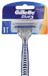
GILLETTE BLUE 3 COMFORT 1/1 BRIJAČ