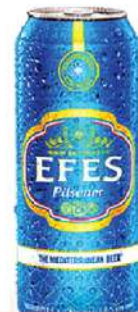
EFES PIVO 0,5L