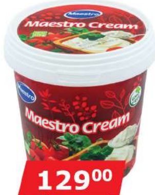
MAESTRO CREAM 670G