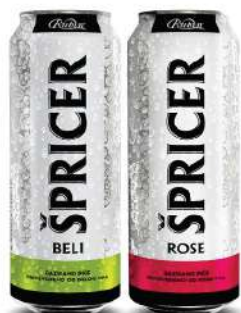
RUBIN ŠPRICER 0,5L BELI/ROSE