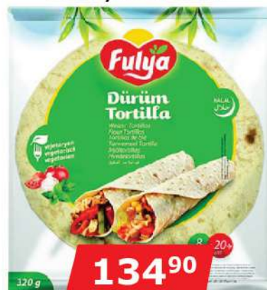
FULYA TORTILJA 8KOM/20CM 320G