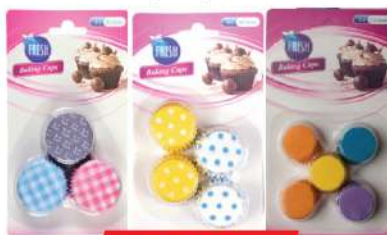
PAPIRNA KORPICA 45/60/70