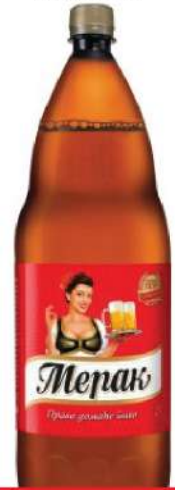
MERAK PIVO 2L