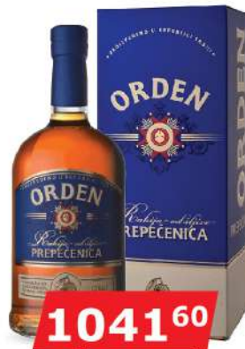
KALEM ORDEN PREPEČENICA 0,7L