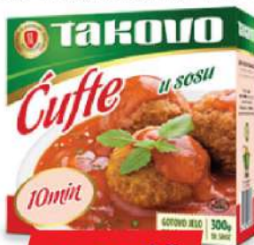
ĆUFTE U SOSU OD PARADAJZA 300G