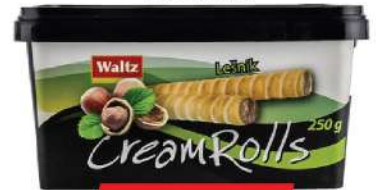
WALTZ ROLLS 250G LEŠNIK