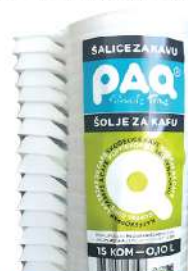
FRESH ŠOLJICA PLASTIČNA 0,10L 15/1