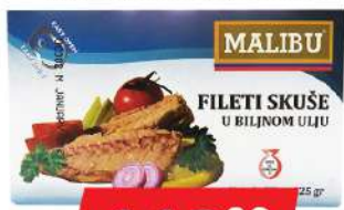
MS MALIBU FILETI SKIŠE 125G