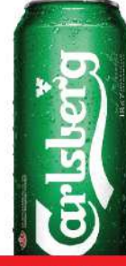
CARLSBERG PIVO 0,5L