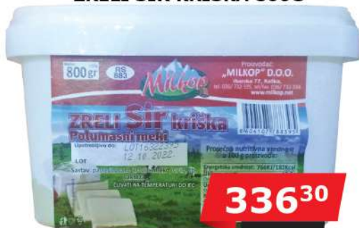
MILKOP NISKOMASNI ZRELI SIR KRIŠKA 800G