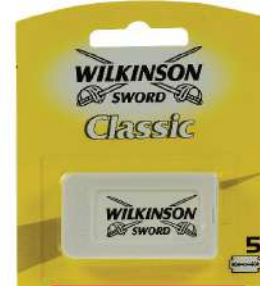
WILKINSON SWORD WILKINSON ULOŠCI DOUBLE EDGE 5KOM BLISTER