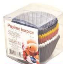
PAPIRNA KORPICA 100/1