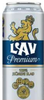
LAV PIVO PREMIUM 0,5L