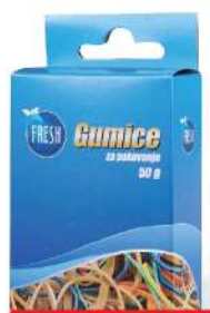
GUMICE ZA PAKOVANJE 100/1