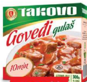
GOVEĐI GULAŠ 300G