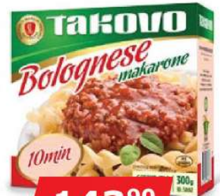
MAKARONE BOLOGNESE 300G