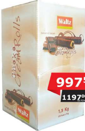
WALTZ CHOKO ROLLS ČOKOLADA 1,5KG 150 KOMADA U KUTIJI