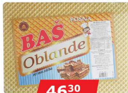
BAŠ OBLANDA 200G