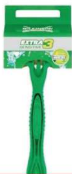
WILKINSON BRIJAČ EXTRA3 SENSITIVE 1 KOM