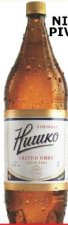
NIŠKO PIVO 2L