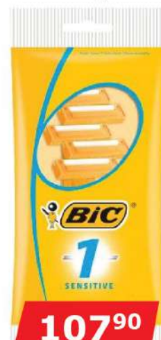
BIC SENSITIVE 1 BRIJAČ 5/1 HC