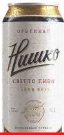
NIŠKO PIVO 0,5L