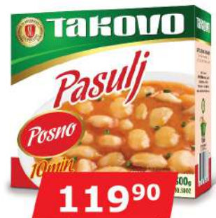
PASULJ POSNI 300G