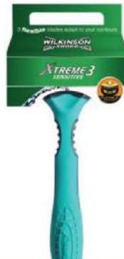
WILKINSON BRIJAČ XTREME3 SENSITIVE 1 KOM