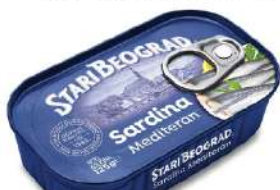
TGK SARDINA U BILJNOM ULJU 125G