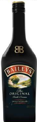
BAILEYS ORIGINAL 0,7L