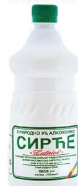
STATUS SIRĆE 1L ALKOHOLNO