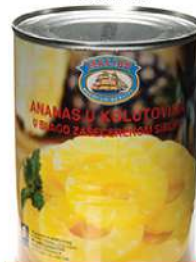
MS MALIBU ANANAS KOMAD 567G