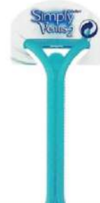
GILLETTE SIMPLY VENUS 2 BRIJAČ 1/1