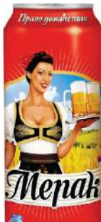
MERAK PIVO 0,5L