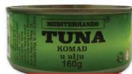
MS MEDITERANEO TUNJEVINA KOMAD 160G