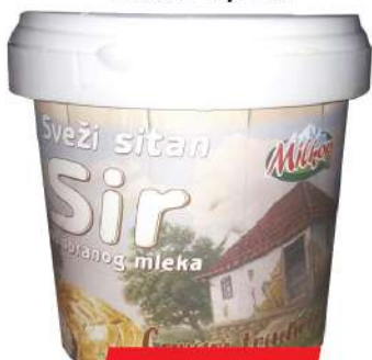
MILKOP SITAN SIR DIJET 0,5KG