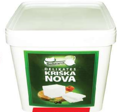
BELLANOVA DELIKATES KRISKA NOVA 8KG