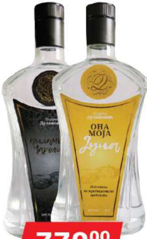
PODRUM DULANOVIĆ ONA MOJA RAKIJA 0,7L VILJAMOVKA/DUNJA