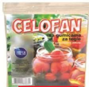
CELOFAN SA GUMICAMA