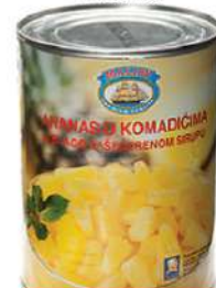
MS MALIBU ANANAS KOMADIĆI 567G