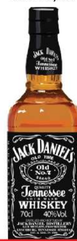
JACK DANIELS 40% 0,7L