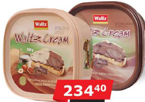
WALTZ CREAM MIX/KAKAO 500G