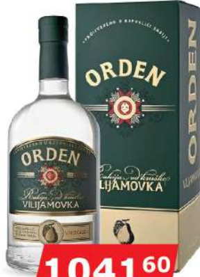
KALEM ORDEN VILJAMOVKA 0,7L