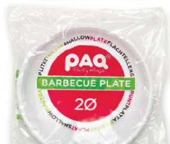
PLASTIČNI TANJIR PLITKI BELI 20/1