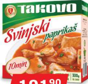
SVINJSKI PAPRIKAŠ 300G