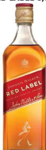
JOHNNIE WALKER RED LABEL 0,7L