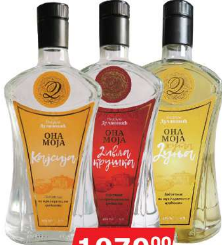
PODRUM DULANOVIĆ ONA MOJA RAKIJA 0,7L KAJSIJA/DIVLJA KRUŠKA/ PREMIUM DUNJA