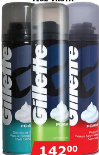
GILLETTE SHAVING FOAM 200ML VIŠE VRSTA