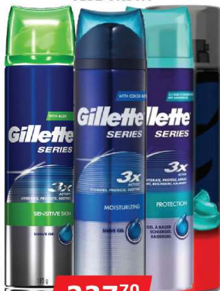
GILLETTE GEL 200ML VIŠE VRSTA