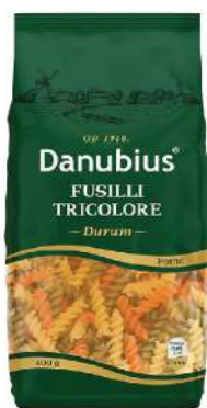
FUSILLI TRICOLORE 400G