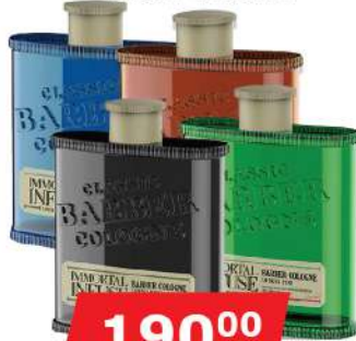
IMMORTAL BARBER COLOGNE 170ML VIŠE VRSTA