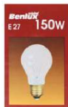
BENLUX SIJALICA E-27 150W