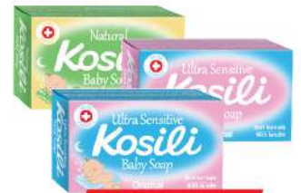
KOSILI SAPUN 75G VIŠE VRSTA