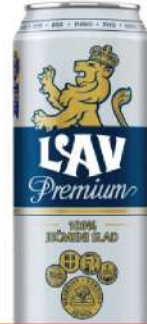
LAV PIVO PREMIUM 0,5L