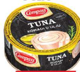
COMPASS TUNA KOMADI 160G U ULJU