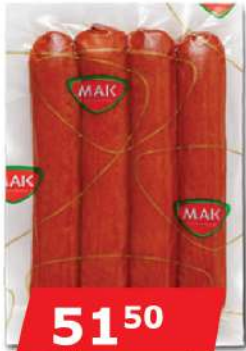
MAK PIKANT KOBASICA 250G