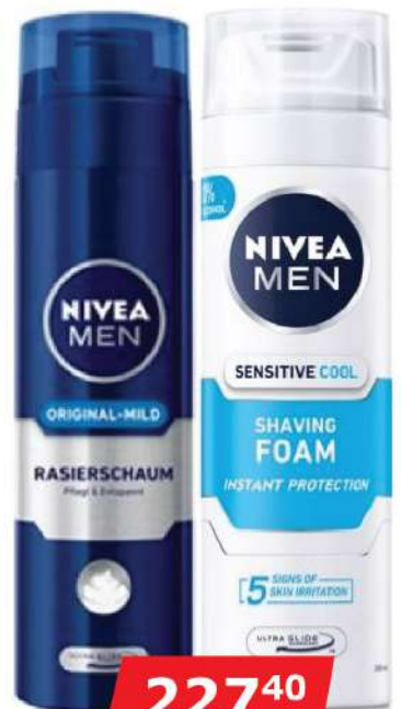
NIVEA SHAVING FOAM 200ML VIŠE VRSTA