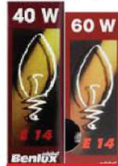
BENLUX SIJALICA E-14 40W/60W