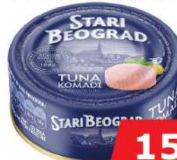
TUNA KOMADI 160G