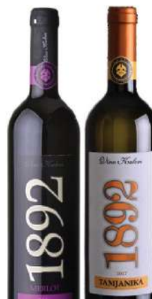
KALEM VINO 0,75L MERLOT TAMJANIKA