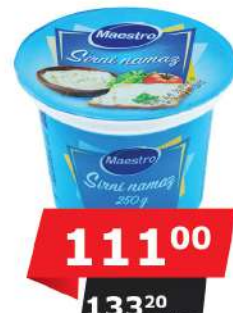
MAESTRO SIRNI NAMAZ 250G