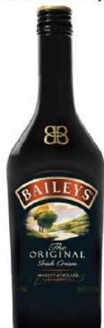
BAILEYS ORIGINAL 0,7L