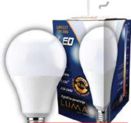
ALFA LUME27-18W 3000K 1750LM LED SIJALICA