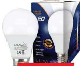
ALFA ECO LUME27-11W 6500K 1000LM LED SIJALICA