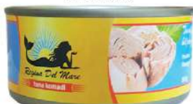
REGINA TUNA KOMADI 160G U ULJU