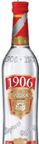
VODKA 1906 0,7L