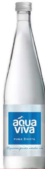
AQUA VIVA VODA 0,75L STAKLO