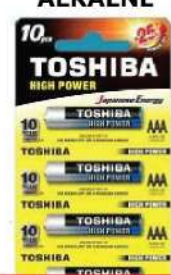
BATERIJE TOSHIBA AAA 1.5V R3 ALKALNE