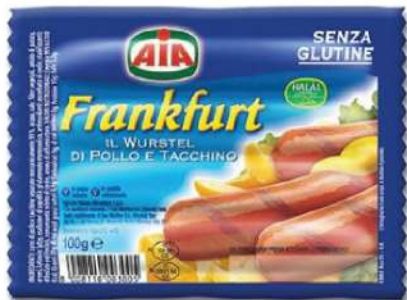
SIL FRANKFURTER ŽIV. VIRSLA 100G