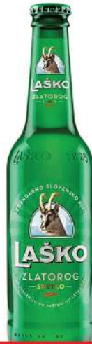
PIVO LAŠKO 0,33L