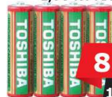
BATERIJE TOSHIBA 1,5V R6 AA 4/1 HD