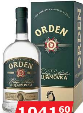
KALEM ORDEN VILJAMOVKA 0,7L