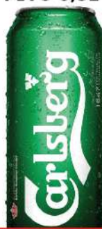
CARLSBERG PIVO 0,5L