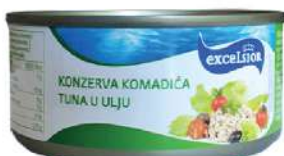
EXCELSIOR TUNA KOMADIĆI 160G U ULJU