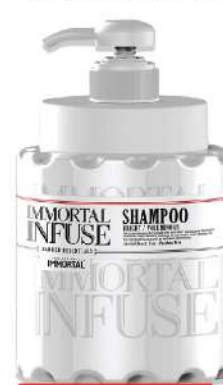
IMMORTAL INFUSE SHAMPOO 1000ML