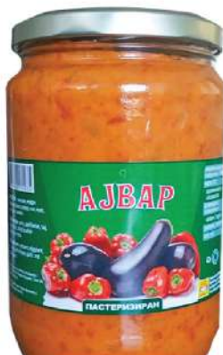
BAŠ AJVAR 660G PASTERIZOVAN