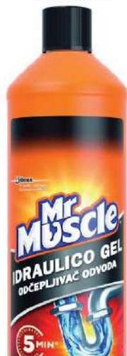
MR MUSOLO GEL ZA ODVODE 1000ML