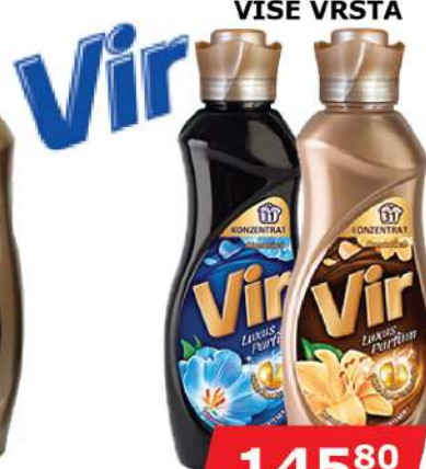
VIR OMEKŠIVAČ 930ML VIŠE VRSTA