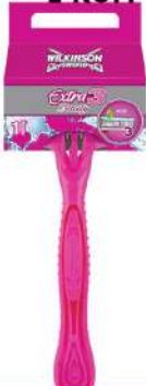
WILKINSON BRIJAČ EXTRA3 BEAUTY 1 KOM