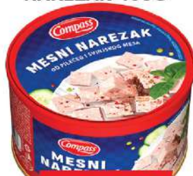
COMPASS MESNI NAREZAK 400G