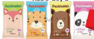
FRESHMAKER VL.MARAMICE KIDS 15/1