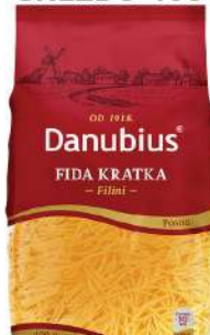
FIDA KRATKA GNEZDO 400G