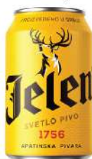
JELEN PIVO 0,33L