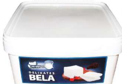
BELLANOVA BELA DELIKATES 5KG