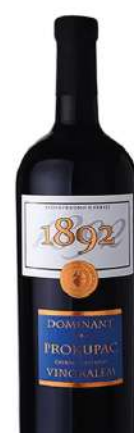
KALEM VINO PROKUPAC 0,75L