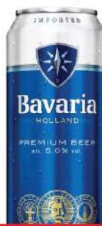
BAVARIA PIVO 0,5L