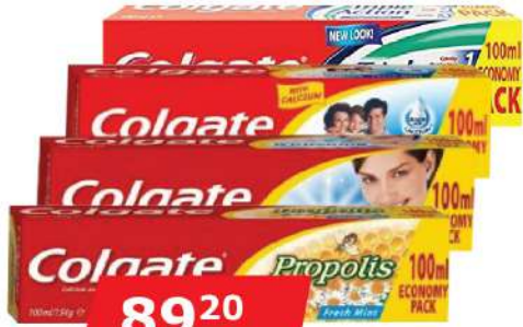
COLGATE PASTA ZA ZUBE 100ML VIŠE VRSTA