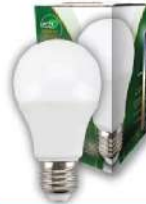
ALFA ECO LUME27-12W 3000K 1055LM LED SIJALICA