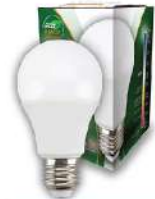
ALFA ECO LUME27-12W 6500K 1055LM LED SIJALICA