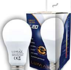
ALFA LUME27-15W 3000K 1510LM LED SIJALICA