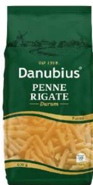
PENNE RIGATE 400G