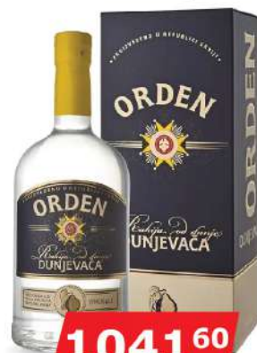
KALEM ORDEN DUNJA 0,7L