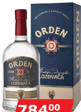
KALEM ORDEN LOZA 0,7L