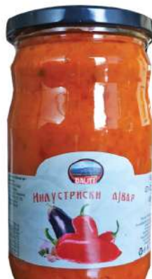
BAŠ AJVAR 680G INDUSTRIJSKI