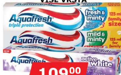
AQUAFRESH PASTA ZA ZUBE 125ML VIŠE VRSTA