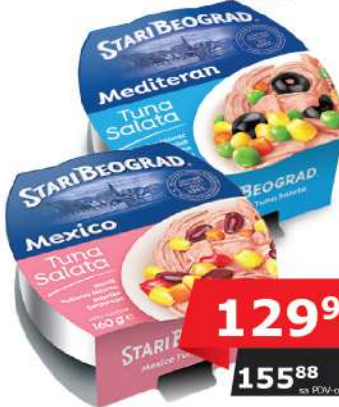
TUNA SALATA 160G MEXICO MEDITERAN ORIENT