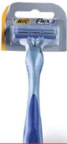
BIC FLEX COMFORT 3 BRIJAČ 1/1