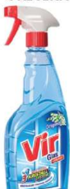
VIR GLASS 750ML ORIGINAL VIR GLASS ZARTE BAUMWOLLE 750ML