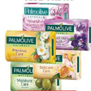
SAPUN 90G VIŠE VRSTA