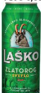
LAŠKO PIVO 0,5L