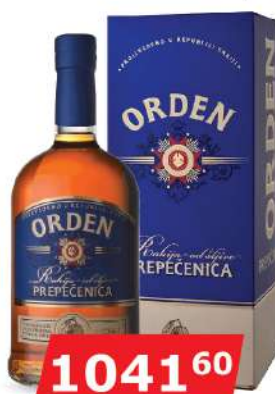
KALEM ORDEN PREPEČENICA 0,7L