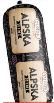
MINI ALPSKA KOBASICA 350G MINI POSEBNA KOBASICA 350G