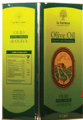
EXTRA VIRGIN OLIVE 4L LIMENKA