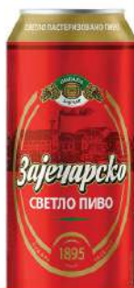
ZAJEČARSKO PIVO 0,5L