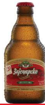
PIVO ZAJEČARSKO 0,33L STAKLO