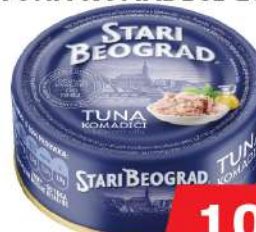
TUNA KOMADIĆI 150G