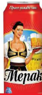
MERAK PIVO 0,5L