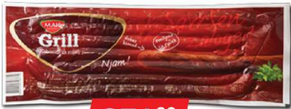
MAK GRILL KOBASICA 1KG