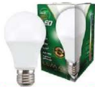
ALFA ECO LUME27-9W 6500K 810LM LED SIJALICA