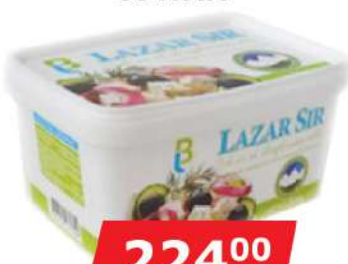
LB BELI SIR 500G 35%MM