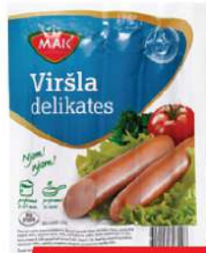
MAK VIRŠLA DELIKATES 200G