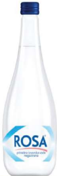
ROSA VODA 0,75L STAKLO