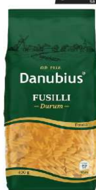
FUSILLI 400G 82/D 3 PRIN.