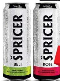
RUBIN ŠPRICER 0,5L BELI/ROŠE