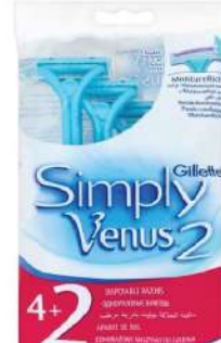
GILLETTE SIMPLY VENUS 2 BRIJAČ 4+2