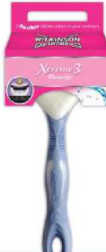
WILKINSON BRIJAČ XTREME3 BEAUTY 1 KOM