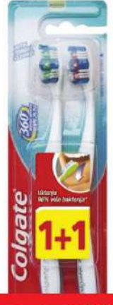
ČETKICA MEDIUM 360 1+1