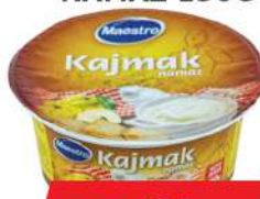
KAJMAK NAMAZ 150G