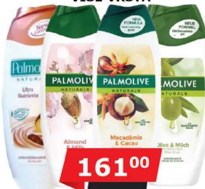
PALMOLIVE KUPKA 500ML VIŠE VRSTA