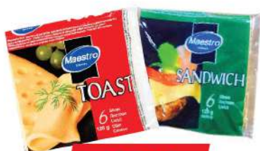
SENDWICH/TOST SIR 120G