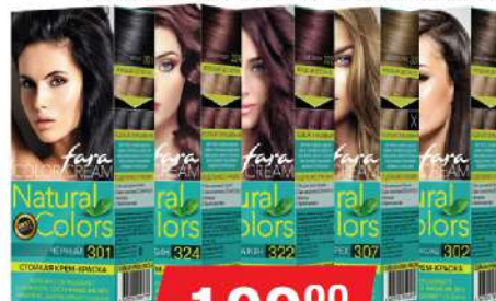
FARA NATURAL FARBA ZA KOSU VIŠE VRSTA