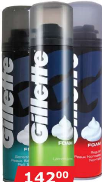
GILLETTE SHAVING FOAM 200ML VIŠE VRSTA