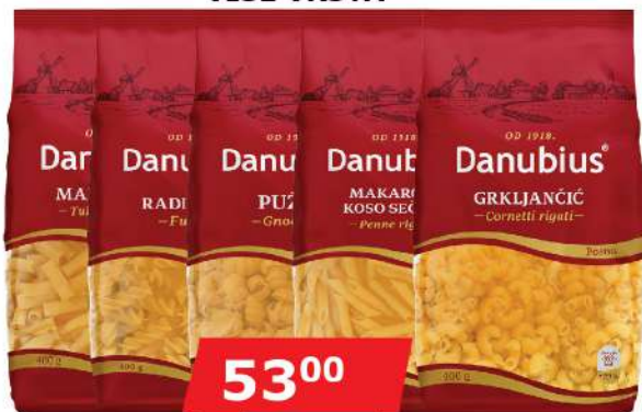
TESTENINA 400G VIŠE VRSTA