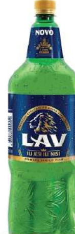
LAV PIVO 2L