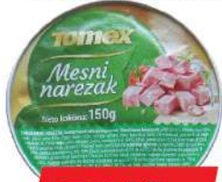
TOMEX MESNI NAREZAK 150G