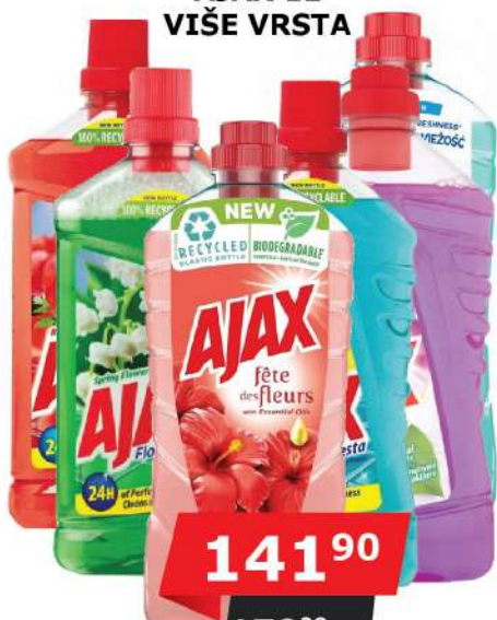
AJAX 1L VIŠE VRSTA