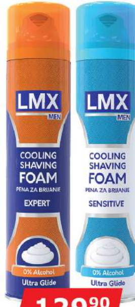
LMX PENA ZA BRIJANJE 300ML VIŠE VRSTA