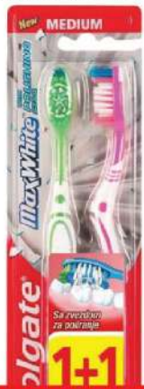
ČETKICA MAX WHITE 1+1