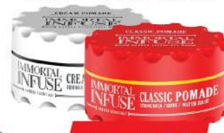
IMMORTAL CLASSIC FIBER POMADE WAX-SPIDER 150ML CREAM POMADE 150ML