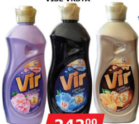
VIR OMEKŠIVAČ 1860ML VIŠE VRSTA