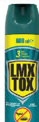
LMX TOX SPREJ ZA GMIŽUĆE INSEKTE 600ML