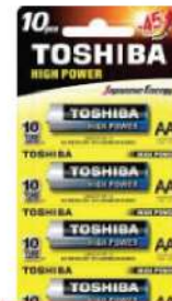
BATERIJE TOSHIBA AA 1.5V R6 ALKALNE