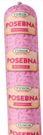
POSEBNA KOBASICA 800G