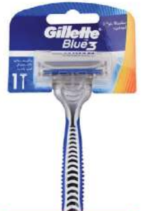
GILLETTE BLUE 3 COMFORT 1/1 BRIJAČ