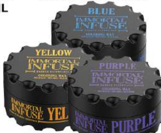
IMMORTAL COLORING WAX 100ML VIŠE VRSTA