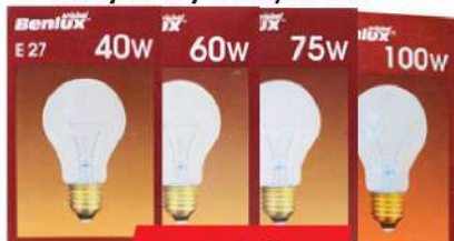
BENLUX SIJALICA E-27 40W/60W/75W/100W