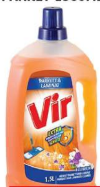
VIR TEČNOST ZA PARKET 1500ML