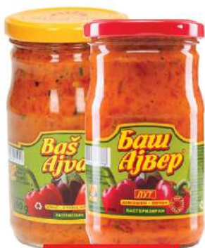
BAŠ AJVAR 290G BLAGI/LJUTI