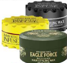
MATTE WAX 150ML STYLING HAIR WAX 150ML GEL STYLING WAX 150ML