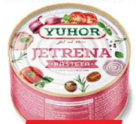
JETRENA PAŠTETA 150G