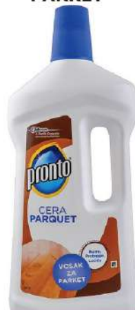
PRONTO VOSAK ZA PARKET