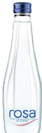
ROSA VODA 0,33L STAKLO