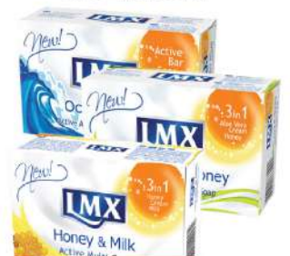
LMX SAPUN 75G VIŠE VRSTA