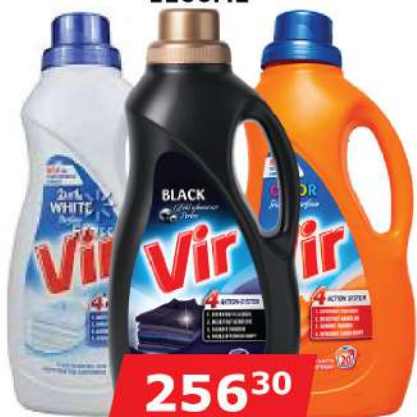
VIR TEČNI DETERDŽENT BELI/CRNI/COLOR 1100ML