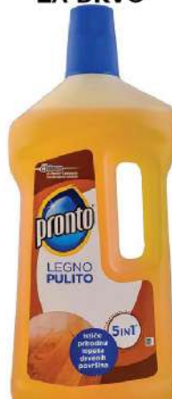
PRONTO 5IN1 PRONTO LEGNO PULITO ZA DRVO