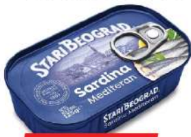
TGK SARDINA U BILJNOM ULJU 125G