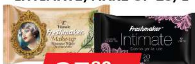
FRESHMAKER VL.MARAMICE INTIMATE/MAKE UP 20/1