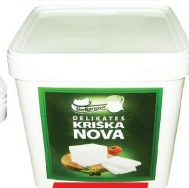
BELLANOVA DELIKATES KRIŠKA NOVA 8KG