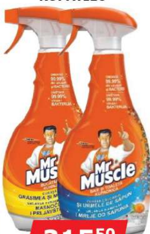
MR MUSOLO 750ML ZA KUHINJU KUPATILO