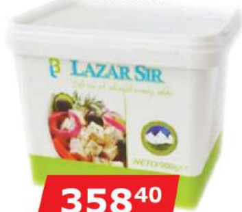
LB BELI SIR 900G 35%MM