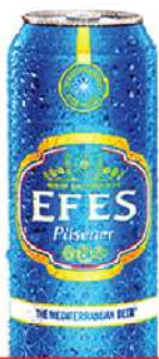
EFES PIVO 0,5L