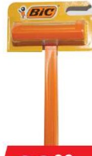
BIC SENSITIVE BRIJAČ 1/1 HC