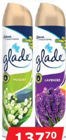
GLADE SPREJ 300ML VIŠE VRSTA