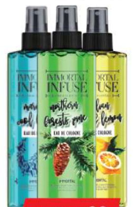
INFUSE SPRAY 400ML VIŠE VRSTA