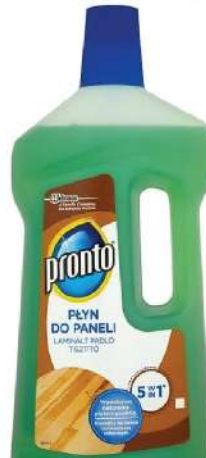
PRONTO ZA ČIŠĆENJE LAMINATA 750ML