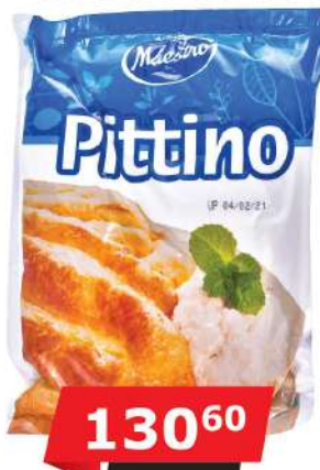
PITTINO SIR 450G