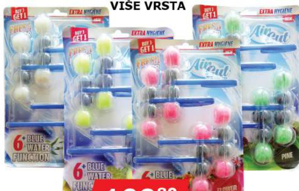
MISS FLORA WC KUGLICE 4X40G VIŠE VRSTA