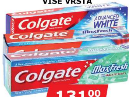
COLGATE PASTA ZA ZUBE 100ML VIŠE VRSTA