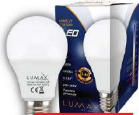
ALFA ECO LUME27-11W 3000K 1000LM LED SIJALICA