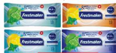
FRESHMAKER VL.MARAMICE ANTIBACTERIAL 15/1