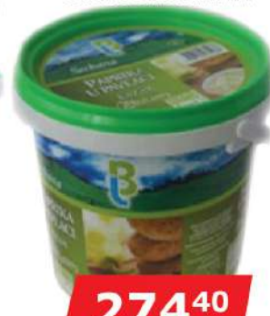
LB PAPRIKA U PAVLACI 600G SECKANA