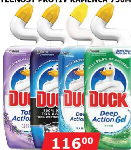
DUCK WC GEL 750ML VIŠE VRSTA TEČNOST PROTIV KAMENCA 750ML