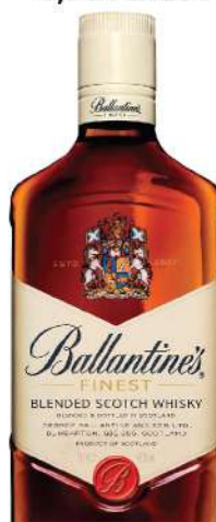
BALLANTINES 0,7L FINEST