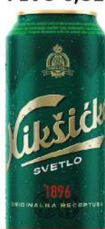
NIKŠIČKO PIVO 0,5L