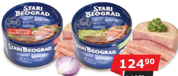
MESNI NAREZAK 400G ČUREĆI NAREZAK 400G