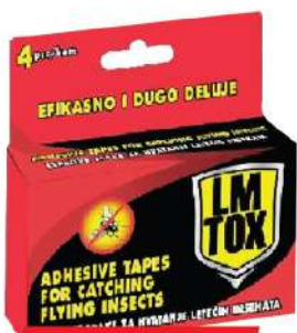
LMX EXTRA STRONG LEPLJ. TRAKA ZA LET.INS.