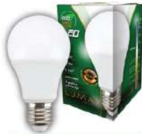
ALFA ECO LUME27-9W 3000K 810LM LED SIJALICA