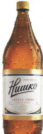
NIŠKO PIVO 2L