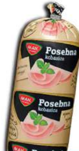
MAK MINI POSEBNA 350G