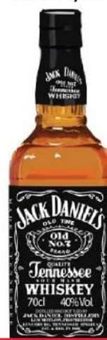
JACK DANIELS 40% 0,7L