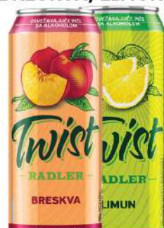
LAV TWIST PIVO 0,5L BRESKVA/LIMUN