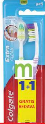
ČETKICA EXTRA CLEAN 1+1