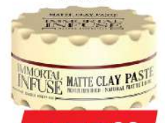
IMMORTAL INFUSE MATTE CLAY PASTE 150ML