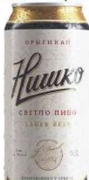
NISKO PIVO 0,5L