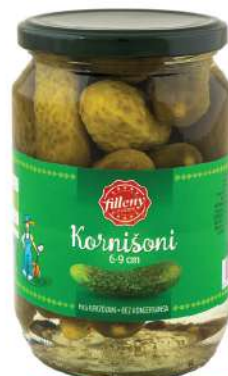
LOV KRSTAVČIĆI 680G