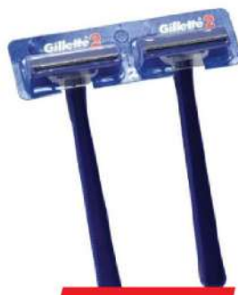
BIC FLEX 3 BRIJAČ 3/1