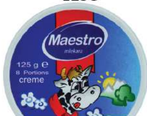
TOPLJENI SIR 125G