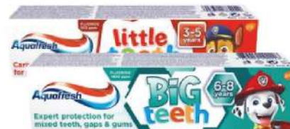
AQUAFRESH PASTA ZA ZUBE 50ML VIŠE VRSTA