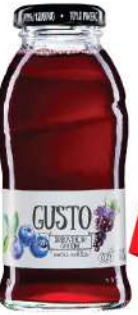
KNJAZ MILOŠ GUSTO VOČNI SOK 0,2L VIŠE VRSTA