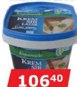
LB KOPAONIČKI KREM SIR 250G