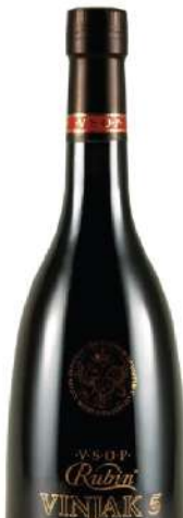
RUBIN VINJAK 5 40% 0,7L