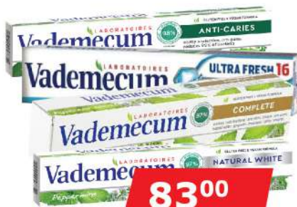
VADEMECIUM PASTA ZA ZUBE 75ML VIŠE VRSTA