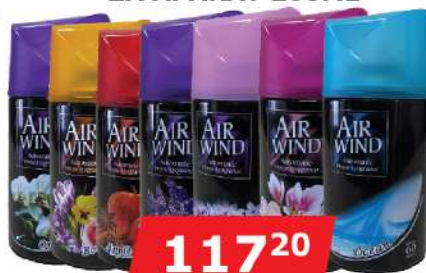
GOOD LINE OSVEŽIVAČ PROSTORA ZA APARAT 260ML