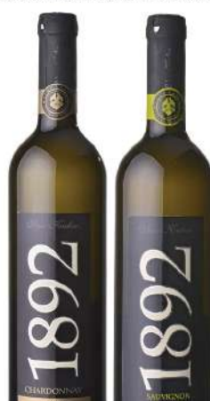
KALEM VINO 0,75L CHARDONNAY SAUVIGNON BLANC