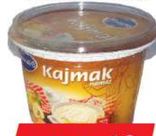
KAJMAK NAMAZ 250G