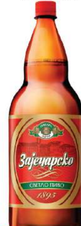
ZAJEČARSKO PIVO 2L