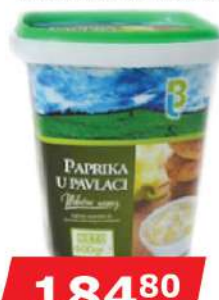
LB PAPRIKA U PAVLACI 400G