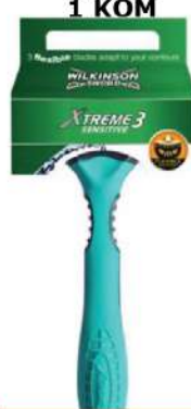
WILKINSON BRIJAČ XTREME3 SENSITIVE 1 KOM