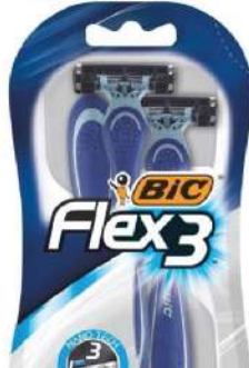
BIC FLEX 3 BRIJAČ 3/1