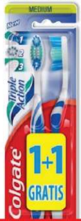
ČETKICA 1+1 TRIPLE ACTION