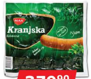
MAK KRANJSKA KOBASICA 1KG