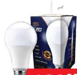
ALFA ECO LUME27-13W 6500K 1280LM LED SIJALICA