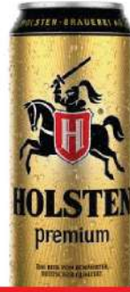
HOLSTEN PIVO 0,5L