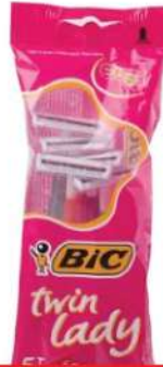
MD BIC TWIN LADY HC 24