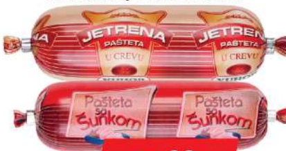
PAŠTETA U CREVU 130G JETRENA/SA ŠUNKOM