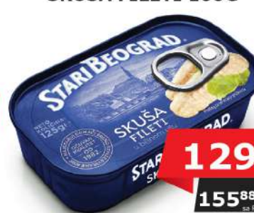
SKUŠA FILETI 100G