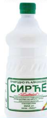
STATUS SIRĆE 1L ALKOHOLNO