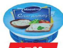
MAESTRO SIRNI NAMAZ 100G