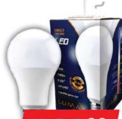
ALFA ECO LUME27-13W 3000K 1280LM LED SIJALICA