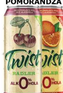
LAV TWIST PIVO 0,5L BEZALK. VIŠNJA POMORANDŽA