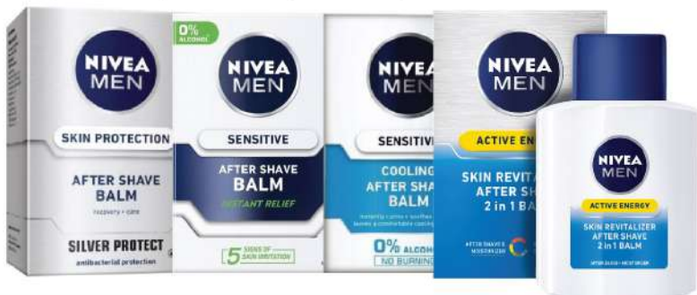
NIVEA BALSAM AFTER SHAVE 100ML VIŠE VRSTA