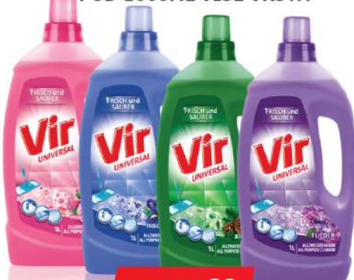
VIR TEČNOST ZA POD 1000ML VIŠE VRSTA