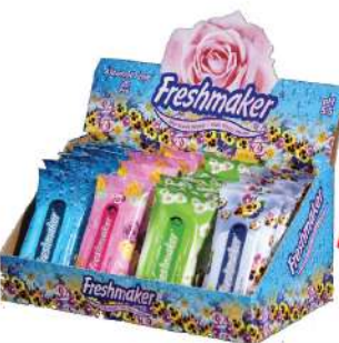
FRESHMAKER VL.MARAMICE CVETNE 15/1