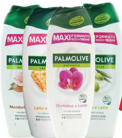
PALMOLIVE KUPKA 750ML VIŠE VRSTA