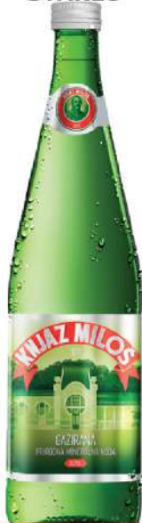
KNJAZ MILOŠ VODA 0,75L STAKLO