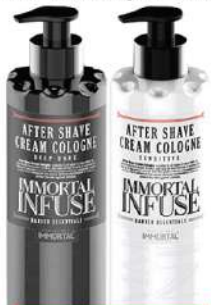
IMMORTAL AFTER SHAVE COLOGNE 400ML DEEP DARK/SENSITIVE