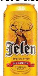
JELEN PIVO 0,5L