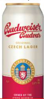
BUDWEISER PIVO 0,5L