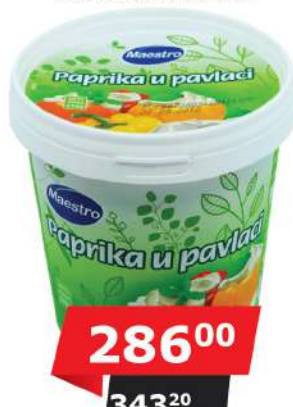
MAESTRO PAPRIKA U PAVLACI 670G