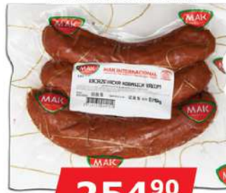
MAK KNJAŽEVAČKA KOBASICA 1KG