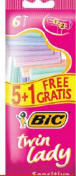
BIC TWIN LADY BRIJAČ 5+1