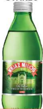
KNJAZ MILOŠ VODA 0,25L STAKLO