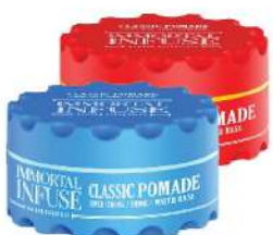
CLASSIC POMADE 150ML