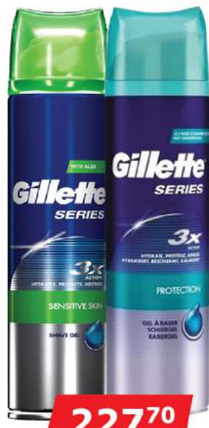
GILLETTE GEL 200ML VIŠE VRSTA