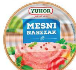
MESNI NAEREZAK 150G