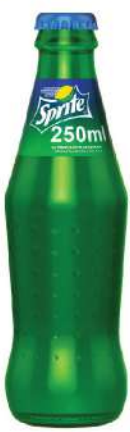
COCA COLA COCA COLA ZERO FANTA ORANGE SPRITE 0,25L STAKLO