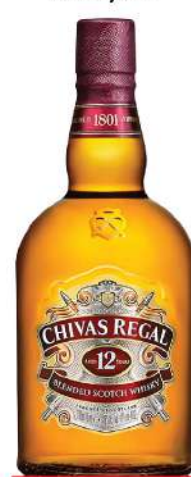
CHIVAS REGAL 12 0,7L